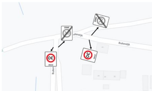
Toevoegen van de zone30-borden op de Buitendijk nabij het Zalmpad .