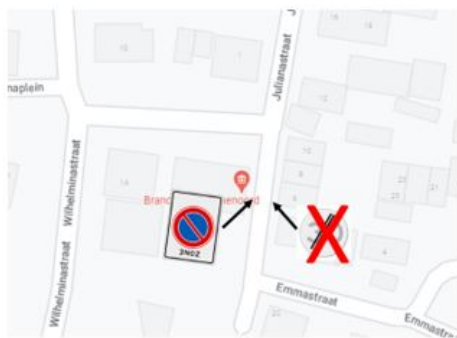
Aanpassing van de bebording op de Julianastraat.