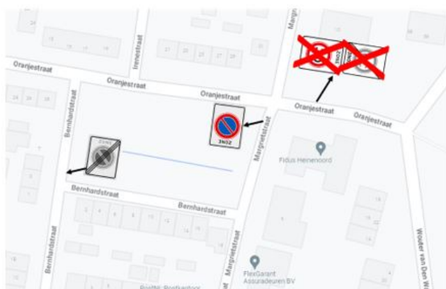
Aanpassing van de bebording op de Bernhardstraat, Margrietstraat en Oranjestraat.