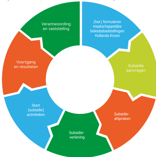
Figuur 1: de cyclus van subsidieverlening

Subsidieverlening is onderdeel van een cyclus die begint met het formuleren van beleidsdoelen. De activiteiten die de gemeente Hollands Kroon subsidieert, dragen bij aan deze maatschappelijke doelen. Op basis van de gemaakte afspraken kunnen organisaties starten met de uitvoering van de activiteiten. Tussentijds en na afloop geven de organisaties informatie over de voortgang en resultaten van de subsidieafspraken. Deze informatie wordt gebruikt om gemeentelijke beleidsdoelen en/of subsidieopdrachten opnieuw te formuleren of bij te stellen waar nodig.