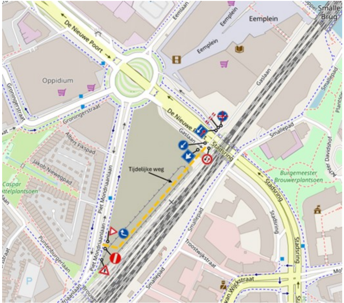
Uitsnede aansluiting tijdelijke weg op Piet Mondriaanlaan