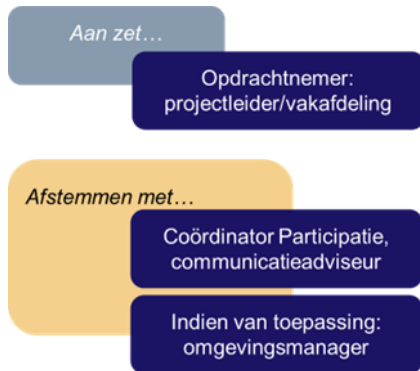
Figuur 8. Rollen bij stap 6.