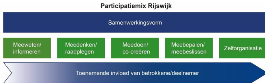
Figuur 9. De Rijswijkse participatiemix.