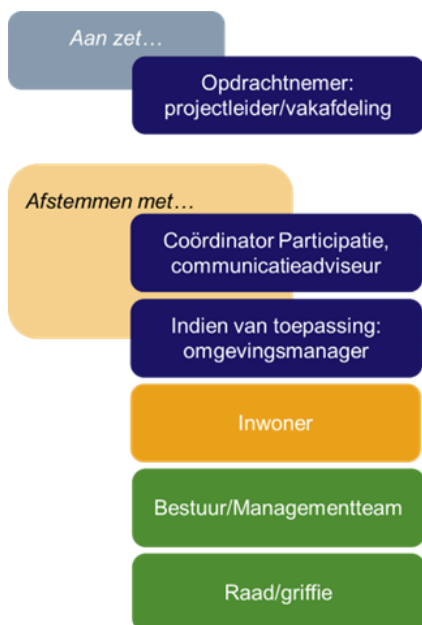
Figuur 10. Rollen bij stap 7

De volgende stap is het opstellen van de participatieaanpak. In de vorige stappen heb je al veel ingrediënten verzameld die nu samenkomen in het participatieplan. In het plan maak je nu echt concreet op welke manieren de participatie invulling krijgt. Daarnaast vul je in deze stap nog een aantal elementen in. Namelijk de rollen, planning en begroting en het communicatieplan. Als het participatieplan klaar is, moet dit worden vastgesteld door het college. Neemt de raad uiteindelijk het besluit? Informeer dan ook de raad over het voorgenomen participatieproces en organiseer commitment. Om te kijken of alle elementen erin zitten, kan gebruikgemaakt worden van de onderstaande checklist. Zorg dat de aanpak ruimte laat om deze gaandeweg bij te stellen als dit nodig is. In overleg met de betrokkenen kan bijvoorbeeld besloten worden om op onderdelen het participatieniveau te wijzigen of om een extra participatiemoment toe te voegen.