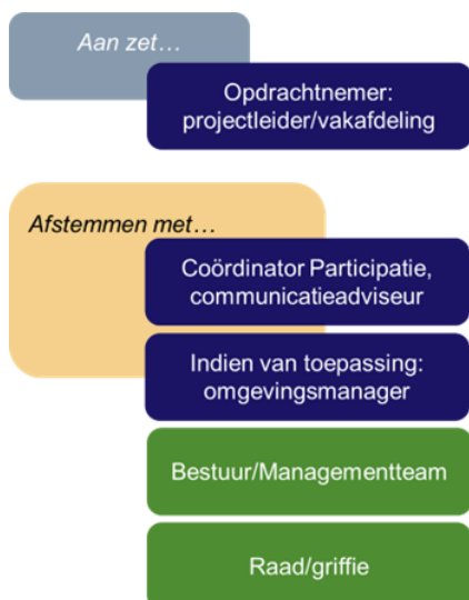
Figuur 5. Rollen bij stap 2.

Het ene project leent zich meer voor participatie dan het andere. Participatie willen we in Rijswijk zorgvuldig doen en ook op die momenten dat de inbreng van inwoners meerwaarde heeft. Inwoners willen graag betrokken zijn en vinden het belangrijk dat er naar hen wordt geluisterd. Tegelijkertijd is het soms ook nodig om gewoon te doen en snel zaken te regelen. We waarderen de inbreng van inwoners, maar willen ook zorgvuldig met hun tijd en betrokkenheid omgaan. Daarom wegen we bij de start van participatie altijd een aantal randvoorwaarden af. Het resultaat van deze stap is een duidelijke richting om jouw participatieaanpak vorm te geven. Door de onderstaande vragen zo expliciet te beantwoorden, kun je er ook achter komen dat participatie niet aan de orde is. Bijvoorbeeld omdat er te weinig ruimte is voor invloed of te weinig tijd voor een goed proces.