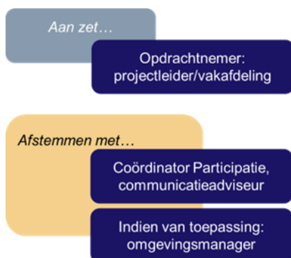
Figuur 6. Rollen bij stap 3.

Tip: Maak deze stakeholderanalyse samen met collega's. Iedereen kent weer andere personen en denkt aan andere organisaties.