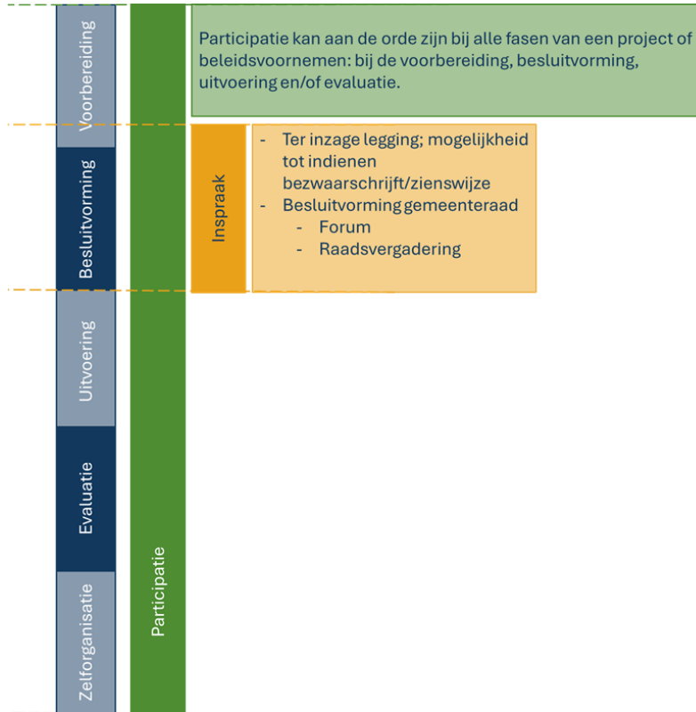
Figuur 2. Tijdljn inspraak en participatie

Inspraak en participatie zijn beide manieren waarop stakeholders kunnen reageren op projecten of beleid vanuit de gemeente. Onderstaande figuur en tabel laten zien wat het verschil is tussen beide.