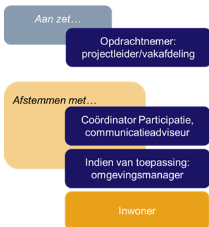
Figuur 7. Rollen bij stap 5.

Ter inspiratie kun je nadenken over het type vraag dat past bij jouw project. De Hogeschool Utrecht onderscheidt twee typen vragen die elk een ander antwoord opleveren en voor welke andere participatietools relevant zijn. Namelijk persoonsgerichte en oplossingsgerichte vragen (zie kader).