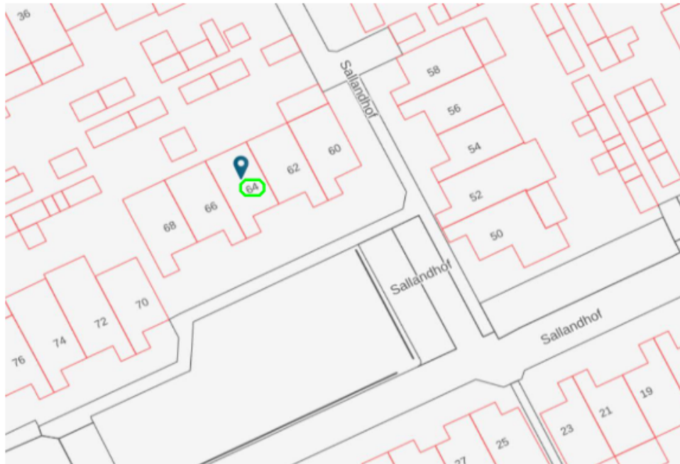
BIJLAGE BIJ VKB 24081 GPP Sallandhof 64, Helmond