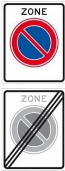
E1 (begin en einde zone)