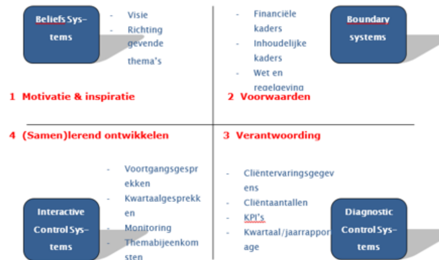
Figuur 1 Model Simons