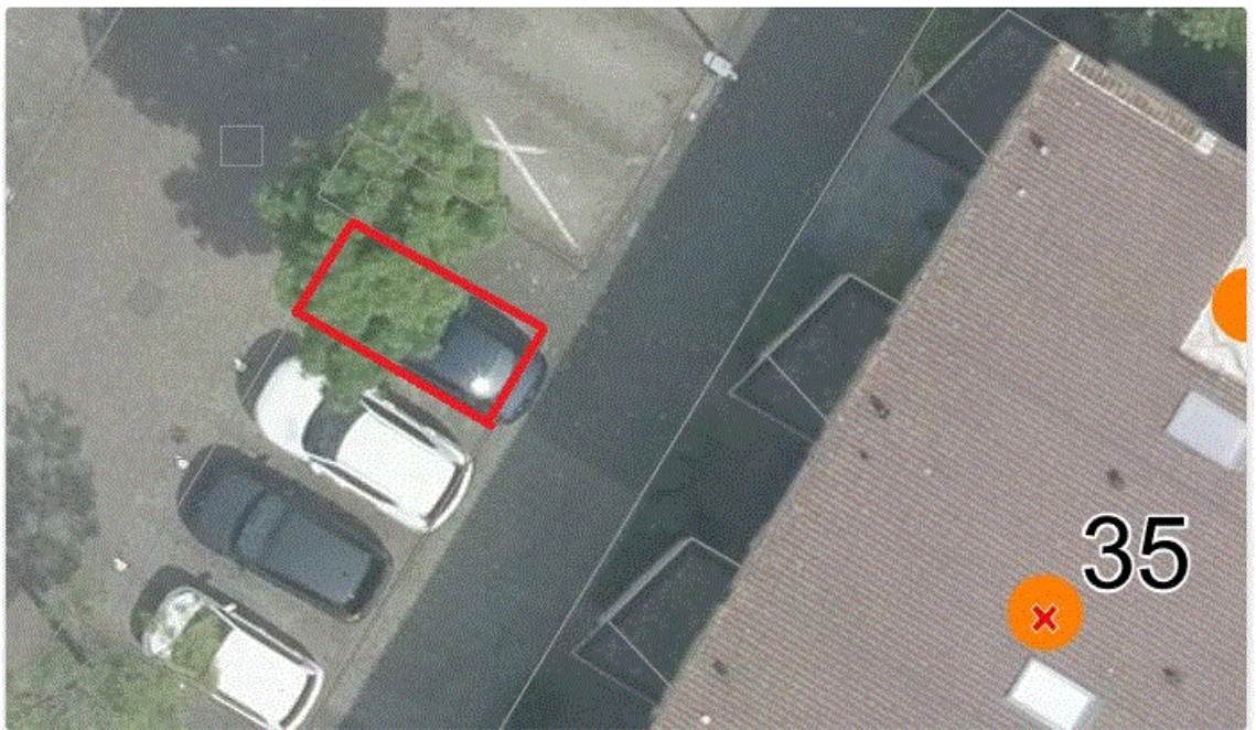
Luchtfoto van locatie aangewezen voor een gehandicaptenparkeerplaats

Burgemeester en wethouders van Hendrik-Ido-Ambacht, 9 oktober 2024