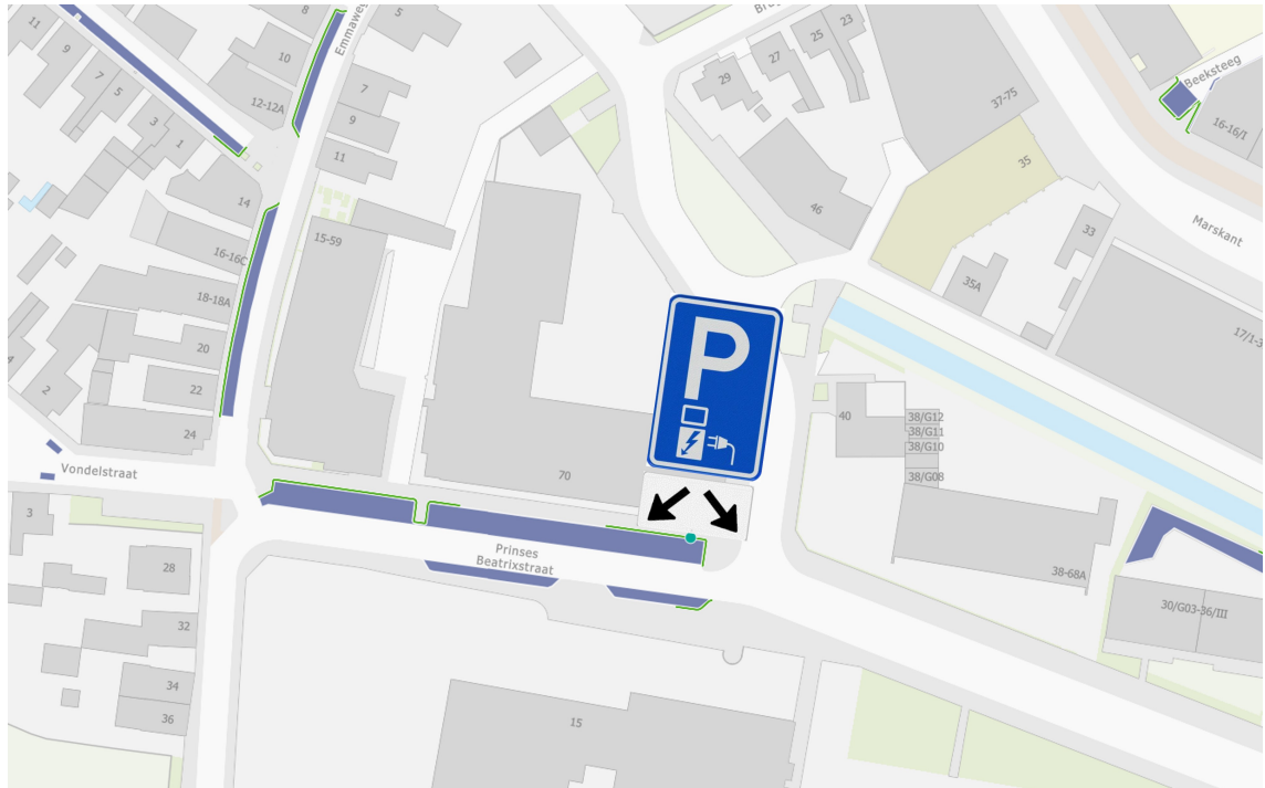
Locatie laadpaal Prinses Beatrixstraat