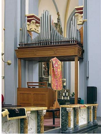
Klein orgel aan de zuidkant van het priesterkoor.