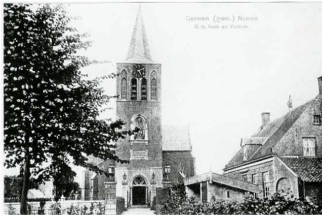
Aansichtkaart van de Oude Sint-Clemenskerk te Gerwen.