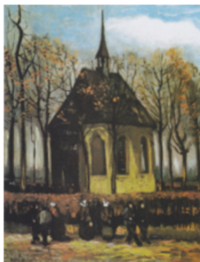
Het uitgaan van de hervormde kerk te Nueneen, olieverf op doek door Vincent van Gogh 1884.