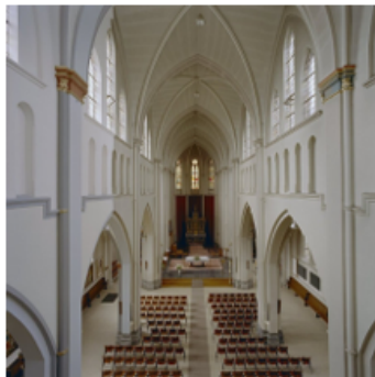
Interieur van de H. Clemenskerk te Nuenen

Het interieur van de Clemenskerk is rijkelijk versierd. De kerk heeft een driebeukige plattegrond. De zijbeuken zijn voorzien van glas-in-loodramen, die zijn ontworpen door Jan Thorn Prikker. Het hoogaltaar is gemaakt van marmer en is versierd met beelden van de heilige Clemens I en de heilige Petrus. In de kerk vinden we nog zeven heiligbeelden vervaardigd tussen 1903 en 1907 door de firma Custers uit Stratum.