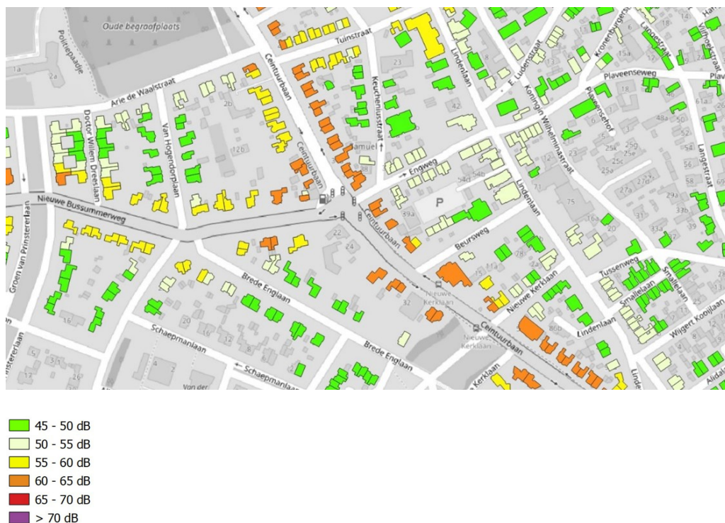
Figuur 1.1: Voorbeeld geluidbelasting op geluidgevoelige gebouwen o.b.v. Omgevingsregeling (ondergrondkaart OpenStreetMap)

De geluidssituatie voor de geluidgevoelige gebouwen is gebaseerd op het geluidmodel dat ook is gehanteerd voor de EU-geluidbelastingskaart 2021. De EU-geluidbelastingskaart [1] beschrijft de geluidssituatie in 2021. Ten behoeve van het actieplan geluid is een aangepaste doorrekening gemaakt op basis van het meet- en rekenmethode geluid wegen uit de Omgevingsregeling [2] . Figuur 1.1 geeft een voorbeeld van de geluidbelasting op pandniveau.