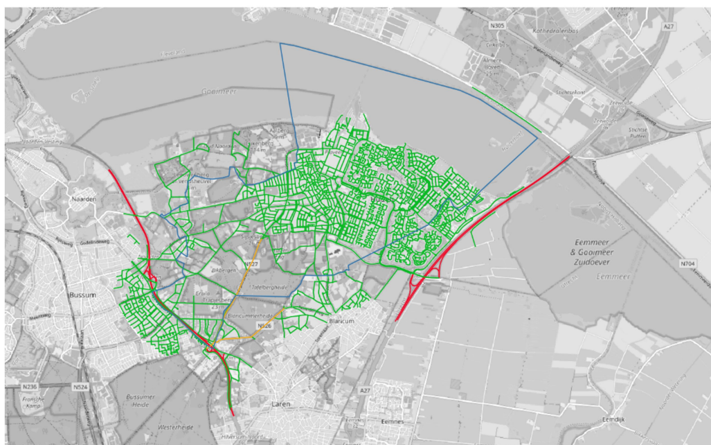
Figuur 3.1: Wegennet Gemeente Huizen en andere bronbeheerders (ondergrondkaart OpenStreetMap)

Rood: rijkswegen; Oranje: provinciale wegen; Groen: gemeentewegen