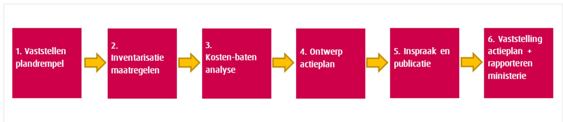
Figuur 2.1: processchema opstellen actieplan geluid

Het proces voor het opstellen van het Actieplan geluid 2024-2029 is schematisch weergegeven in figuur 2.1. Hierna zijn de stappen kort beschreven.