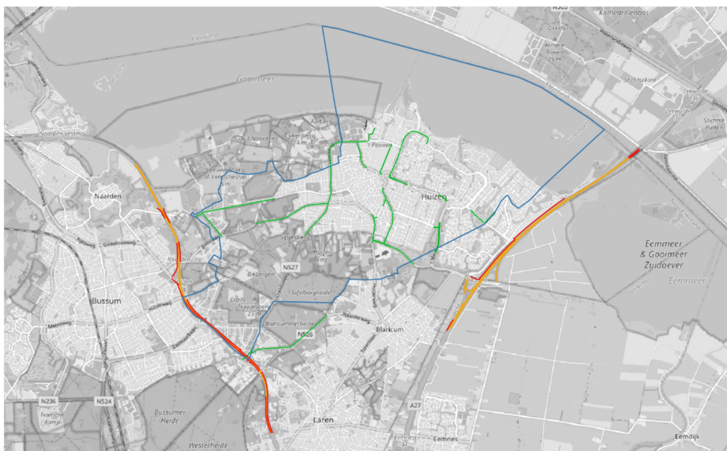
Figuur 3.2: Overzicht toegepaste geluidreducerende maatregelen (ondergrondkaart OpenStreetMap)

Oranje: ZOAB; Groen: SMA; Rood: afscherming