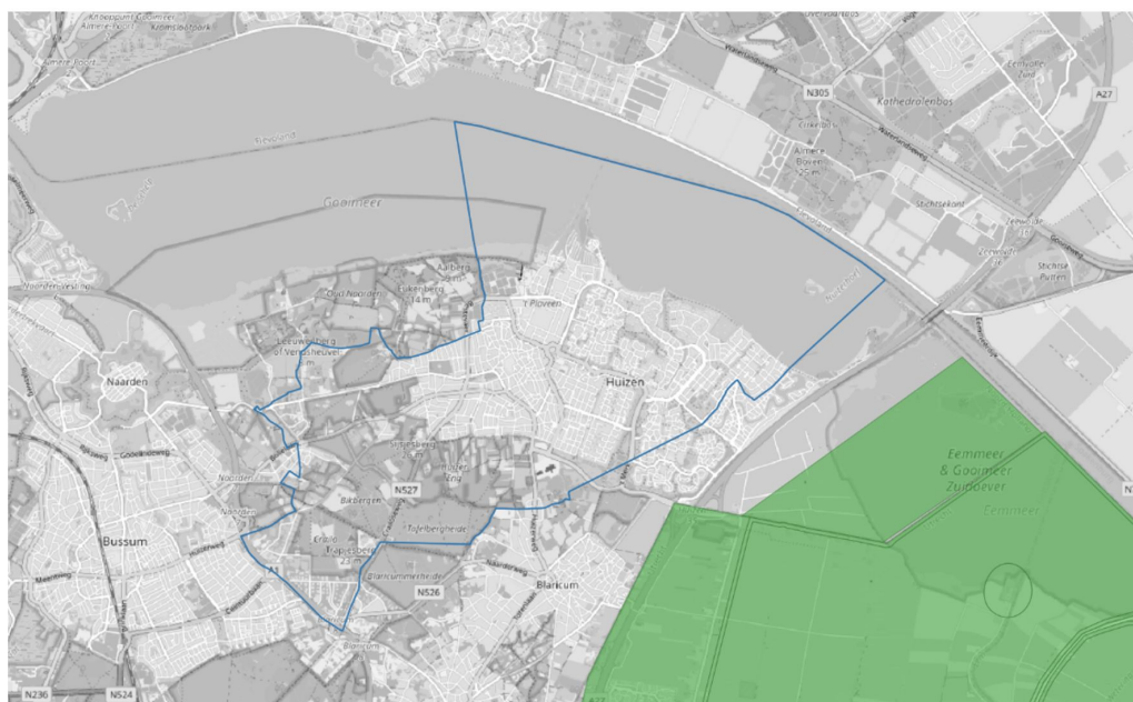
Figuur 1.2: Stiltegebieden Eemmeer en Eemland nabij gemeente Huizen (ondergrondkaart OpenStreetMap)

Binnen de Gemeente Huizen zijn geen gebieden gelegen die bij provinciale verordening aangewezen zijn als stiltegebied. Ten oosten van de gemeente liggen twee stiltegebieden. Dit betreffen de gebieden Eemmeer in de Gemeente Blaricum en Eemland in de gemeente Eemnes. In stiltegebieden milieubeschermingsgebieden geniet het milieu bijzondere bescherming. Voor stiltegebieden geldt een streefwaarde van 40 dB. Dit is echter geen harde norm. Figuur 1.2 geeft de ligging van de stiltegebieden nabij de gemeente Huizen weer.