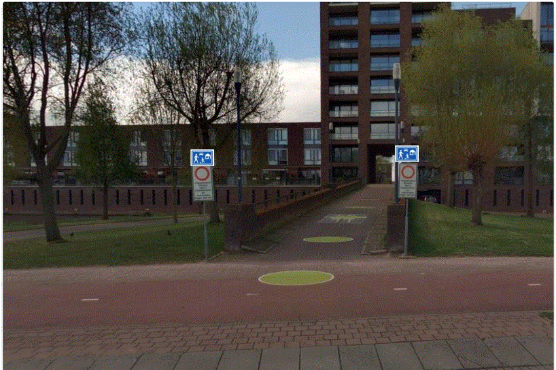
Afbeelding plaatsing borden G5 (woonerf)