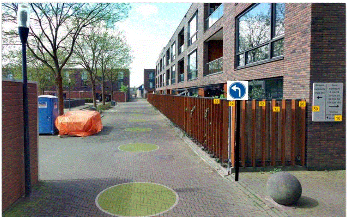
Afbeelding plaatsing bord D5 (verplichte rijrichting, links) met onderbord OB02 (uitgezonderd fietsers)

Burgemeester en wethouders van Hendrik-Ido-Ambacht, 1 oktober 2024