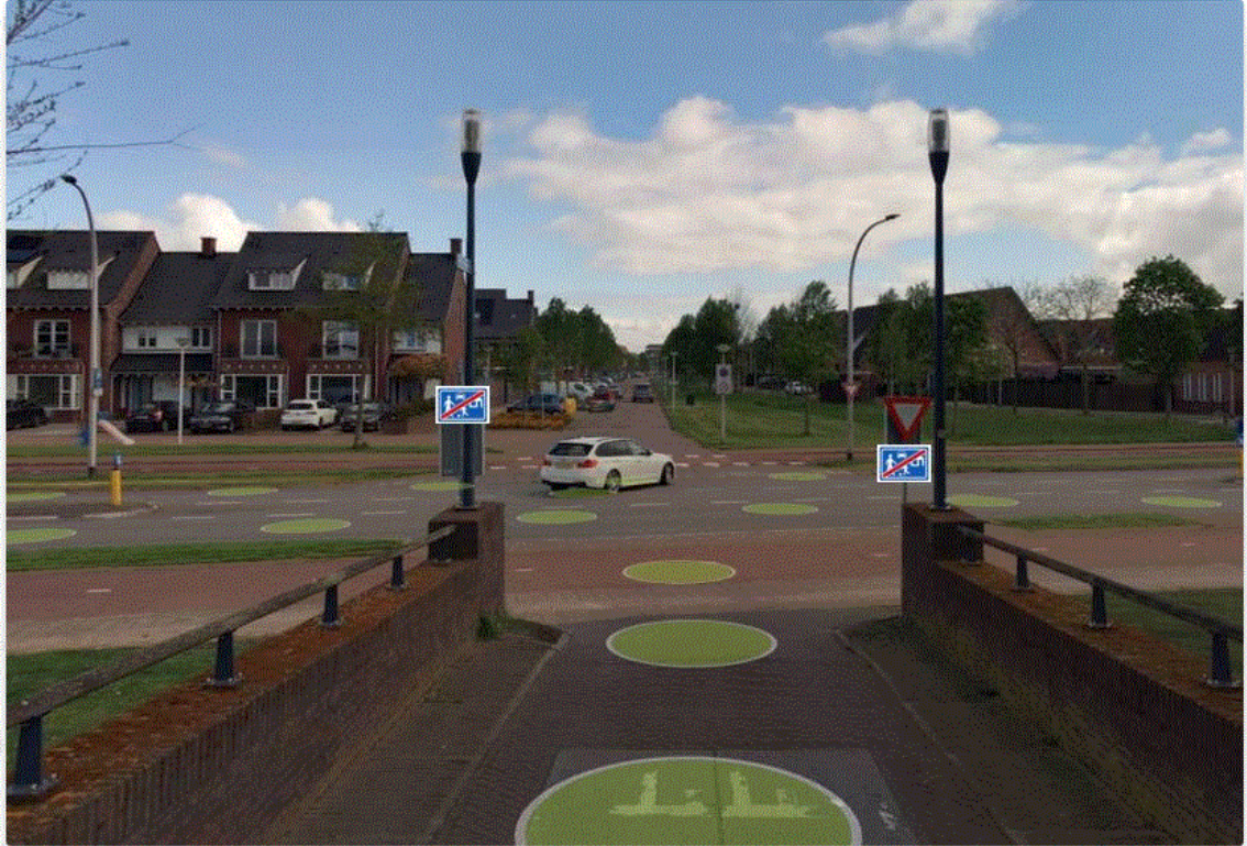
Afbeelding plaatsing borden G6 (einde woonerf)