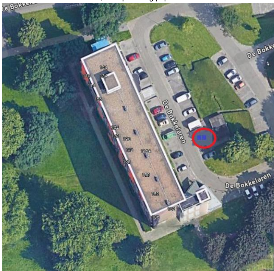
Locatie: De Bokkelaren 110-216, voor plaatsing papier- en restcontainer