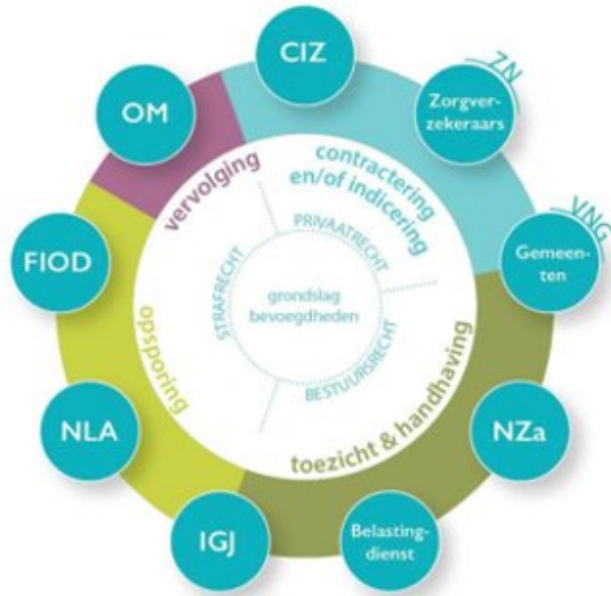
Figuur 1: Samenwerkingspartners IKZ

De TIZ heeft een sturende rol in het bestrijden van fouten en fraude in de zorgsector. Het is een samenwerkingsverband van de NZa, de Inspectie Gezondheidszorg en Jeugd (IGJ), Zorgverzekeraars Nederland (ZN), het CIZ, de Belastingdienst, de NLA, de FIOD, het OM, de VNG, SVB en het Ministerie van Volksgezondheid, Welzijn en Sport (VWS).