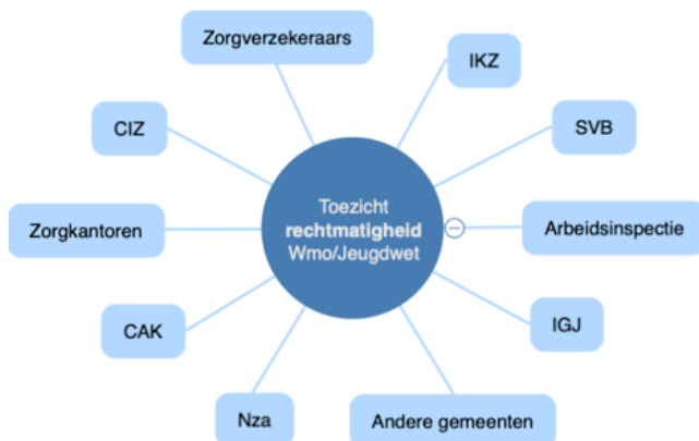
Figuur 2: Ketenpartners bij rechtmatigheidstoezicht Wmo en Jeugdwet

VNG Naleving adviseert en ondersteunt gemeenten bij het uitvoeren van handhavingstaken van de wetten in het sociaal domein, waaronder ook de Wmo en Jeugdwet.