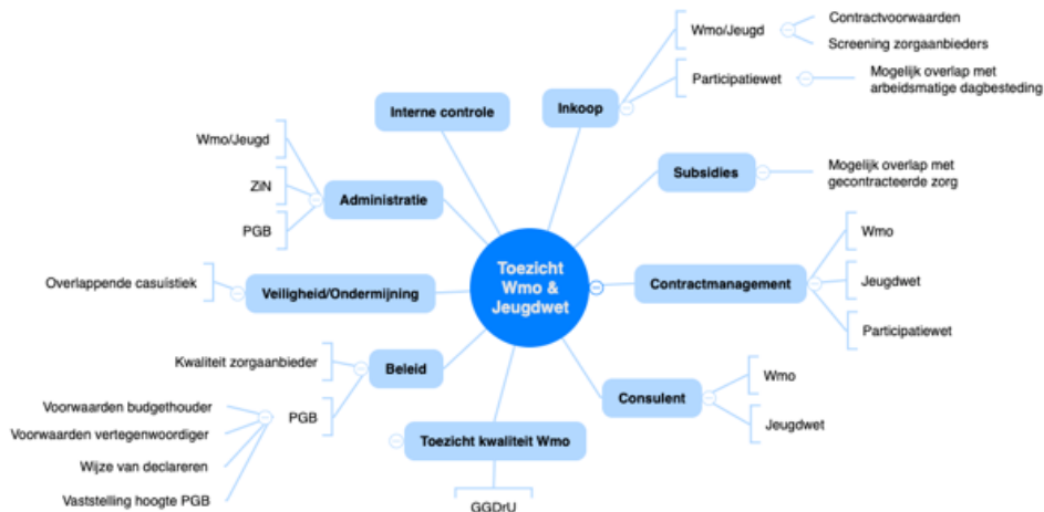
Figuur 5: Stakeholders

Bij de preventie van zorgfraude zijn er binnen de gemeente Zeist, naast de toezichthouder, diverse stakeholders met verschillende taken en bevoegdheden. De toezichthouder is hierbij een belangrijke schakel. Samenwerking en informatie-uitwisseling is hierbij essentieel.