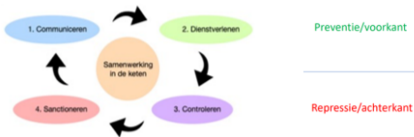
Figuur 3: Cirkel van Naleving

Communiceren/voorlichten - Cliënt kent en begrijpt (het waarom van) rechten en plichten. Aanbieder kent en begrijpt (het waarom van) rechten, plichten en kwaliteitseisen. Cliënt en aanbieder kennen de gevolgen van niet nakomen.