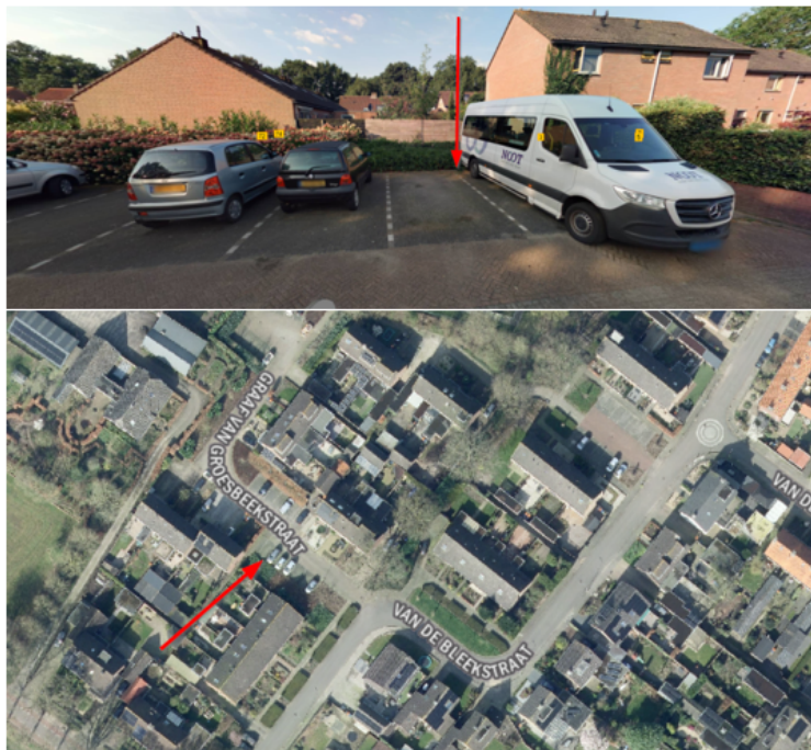
6. Magalhaesstraat 19, Barneveld: