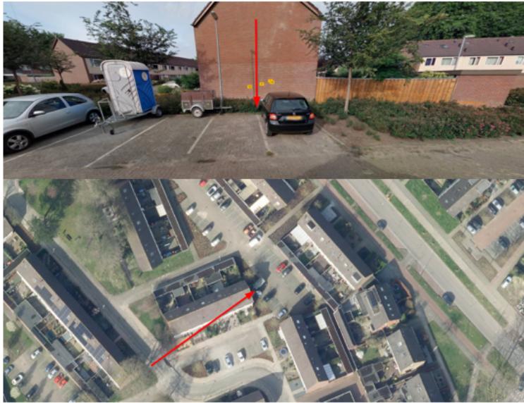
7. Stroeërweg 49A, Stroe: