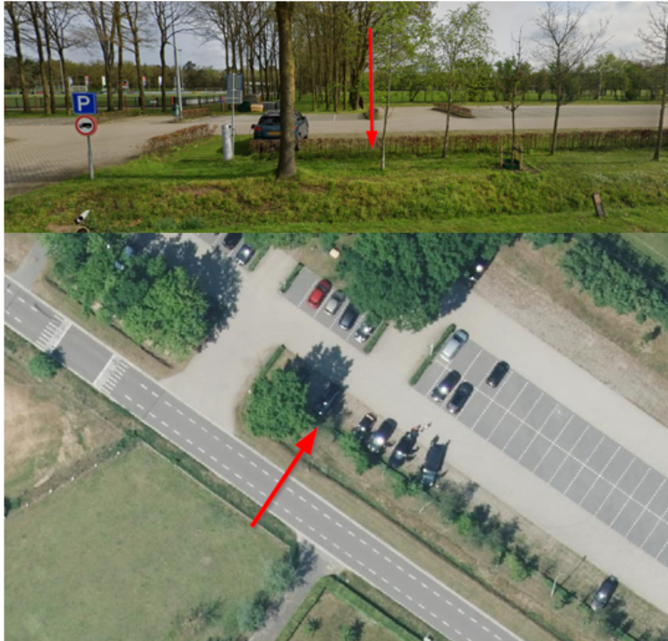
13. Oosterkamp 28, Voorthuizen: