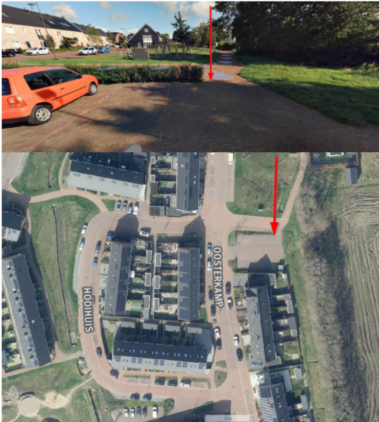
14. Van Haersoltelaan 8, Barneveld: