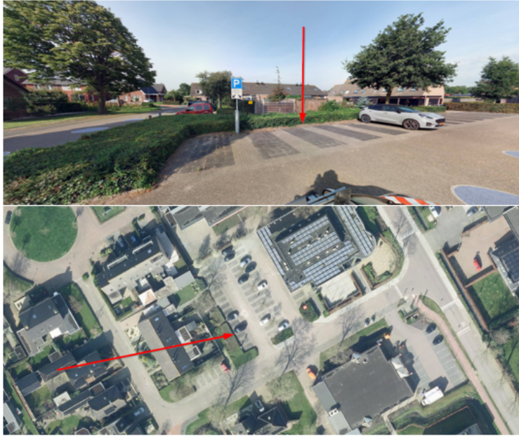
9. G.H. Roeterdinkstraat 2-32, Voorthuizen: