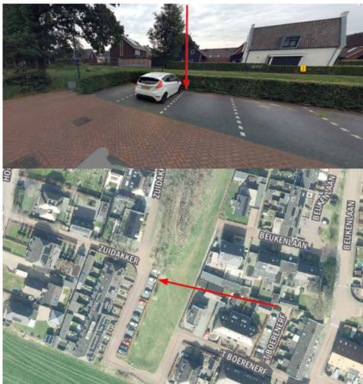
4. Archimedesstraat 108, Barneveld: