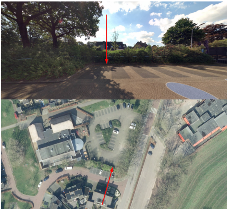
8. Albert van Meerveldstraat 97, Zwartebroek: