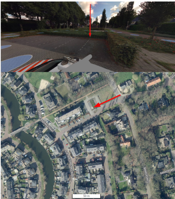
10. Heuvelskamp 8, Voorthuizen: