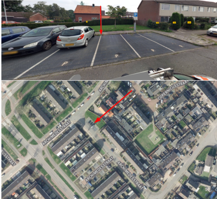
5. Graaf van Groesbeekstraat 3, Terschuur: