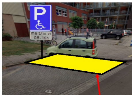
Plaatsen bord E6 (Gehandicaptenparkeerplaats) met onderbord OB309 (Ma t/m. vr 8:00-16:00 uur)

Aanwijzen algemene gehandicaptenparkeerplaats Aan de Put (Basisschool 't Valder) Tekeningnummer DS-2024-04-16 Datum: 16 april 2024