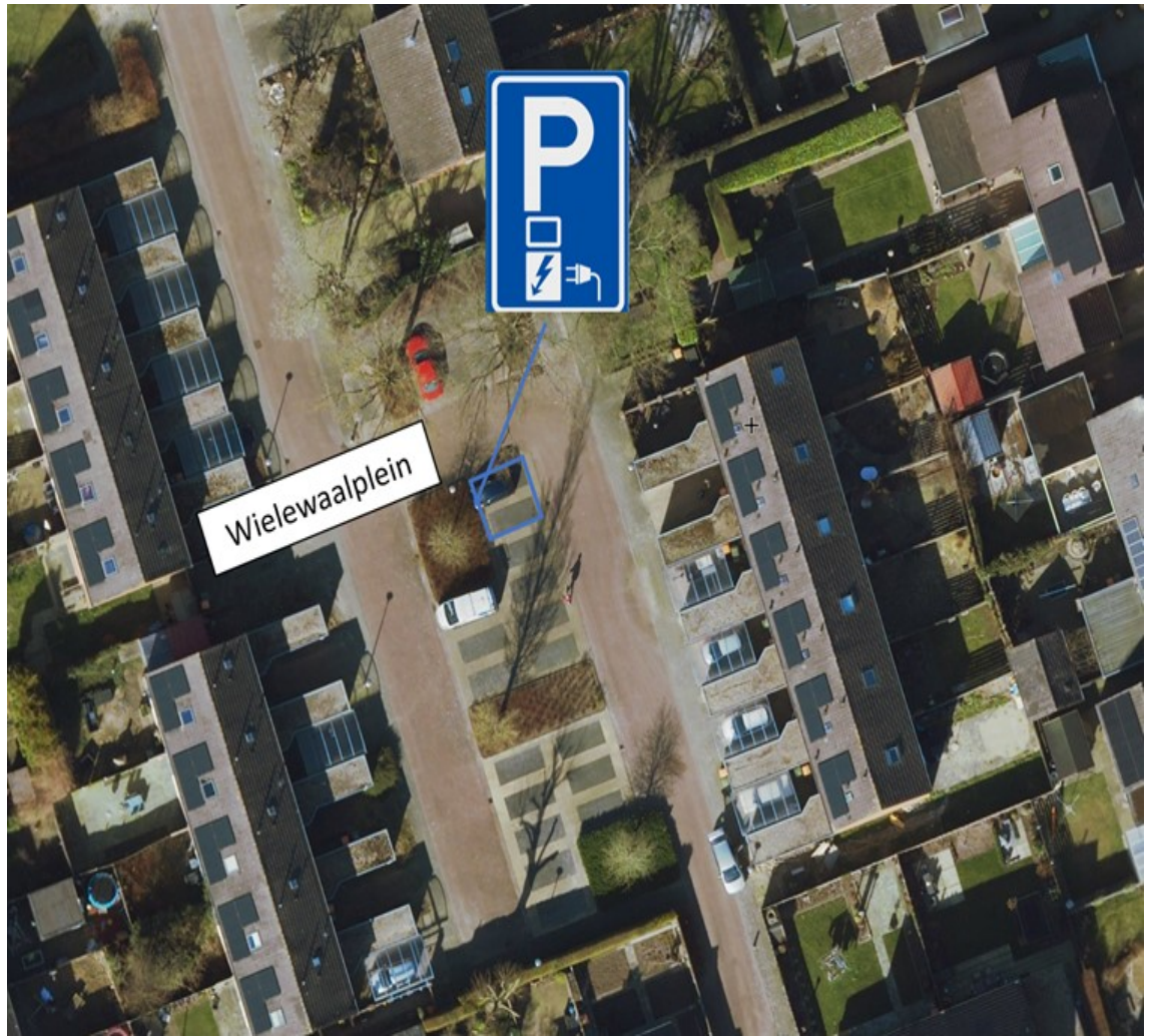
Vriesenhof t.h.v. nummer 11 te Dalfsen;