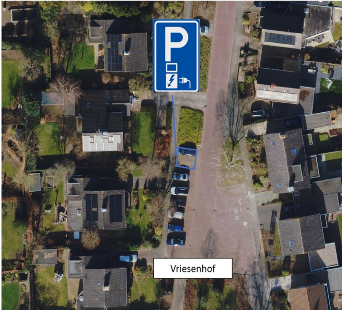
Vennenland t.h.v. nummer 9 te Nieuwleusen;