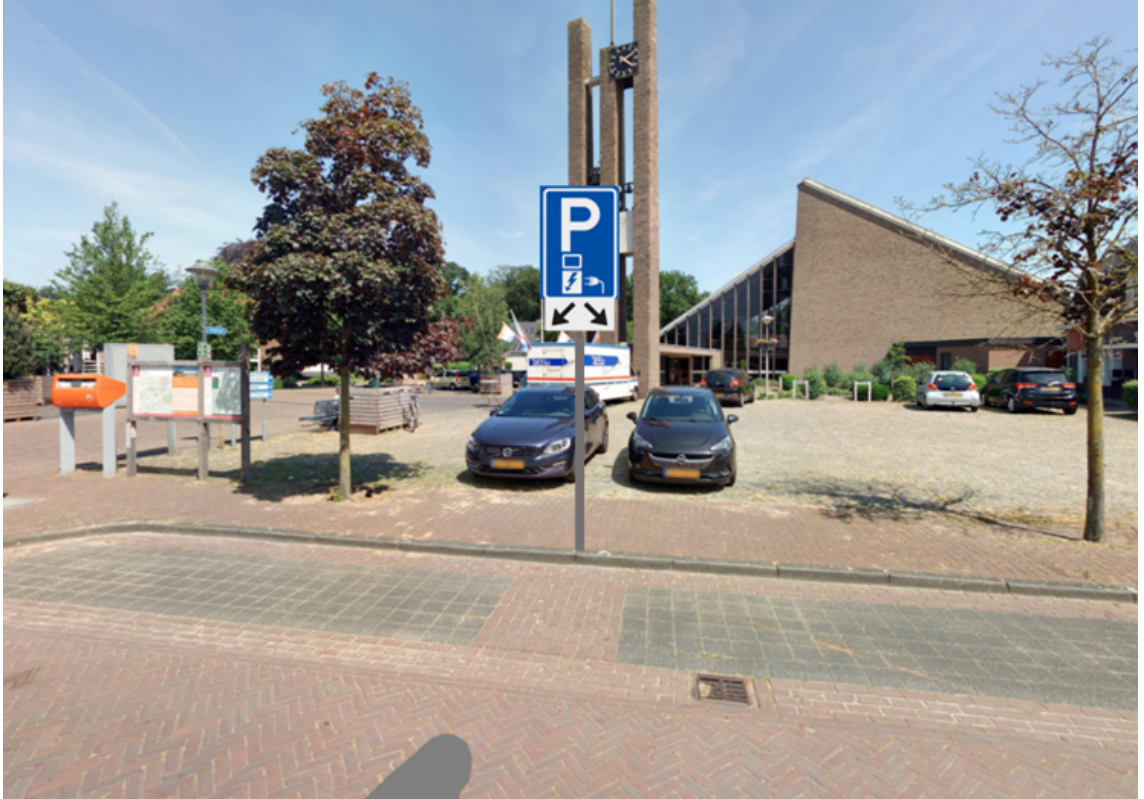
Pleijendal t.h.v. nummer 8