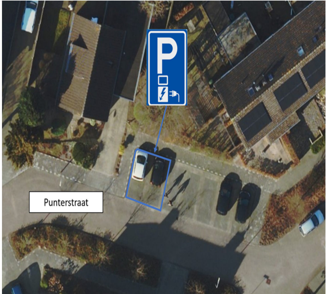
P. Buismanstraat t.h.v. nummer 9 te Lemelerveld;