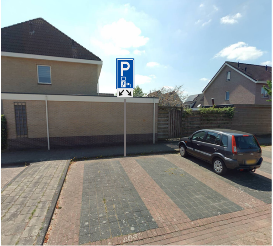
Weegbree t.h.v. nummer 47