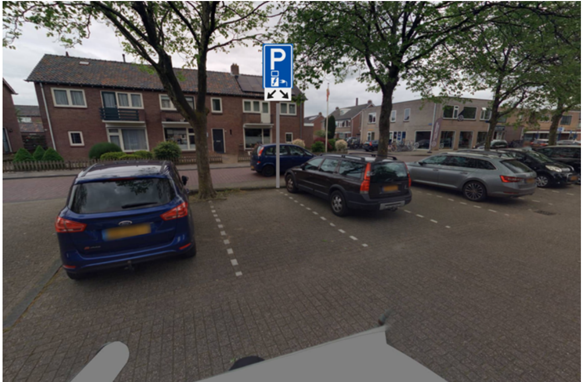
Ribberserf t.h.v. nummer 2