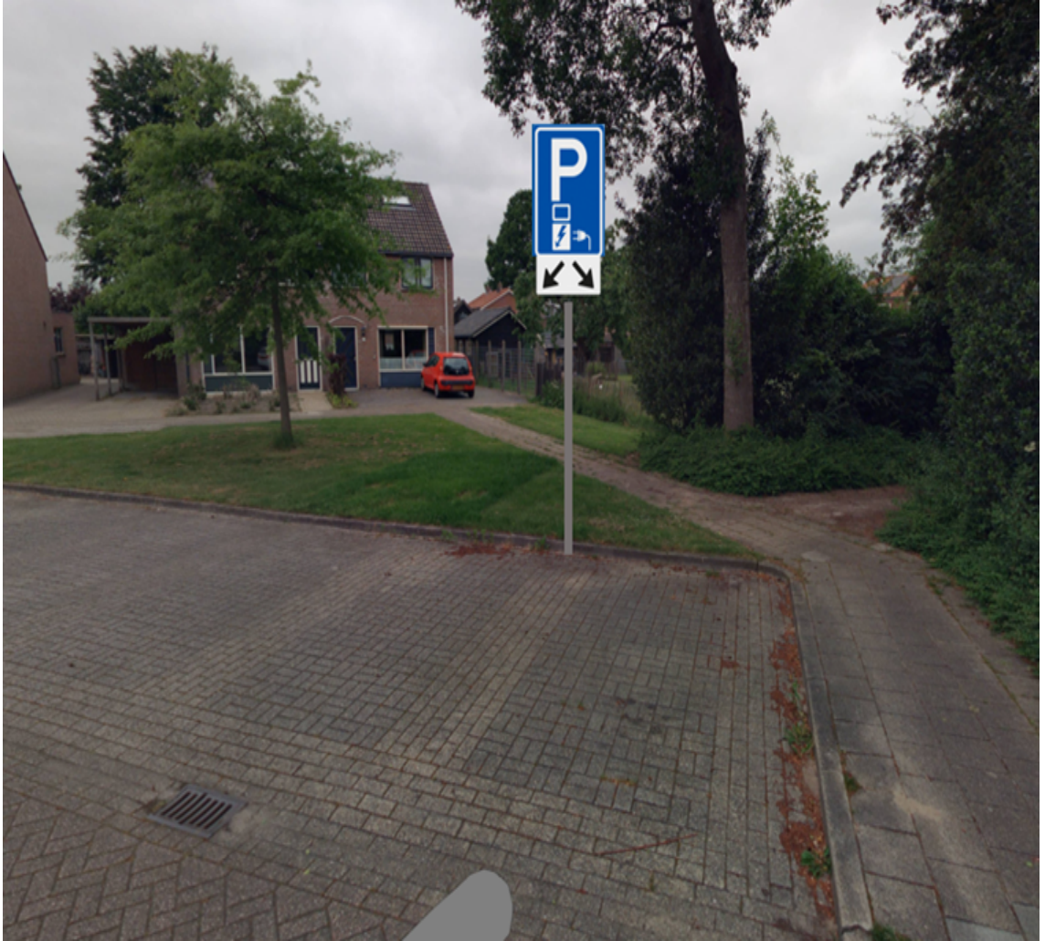
Wielewaalplein t.h.v. nummer 17 te Nieuwleusen;