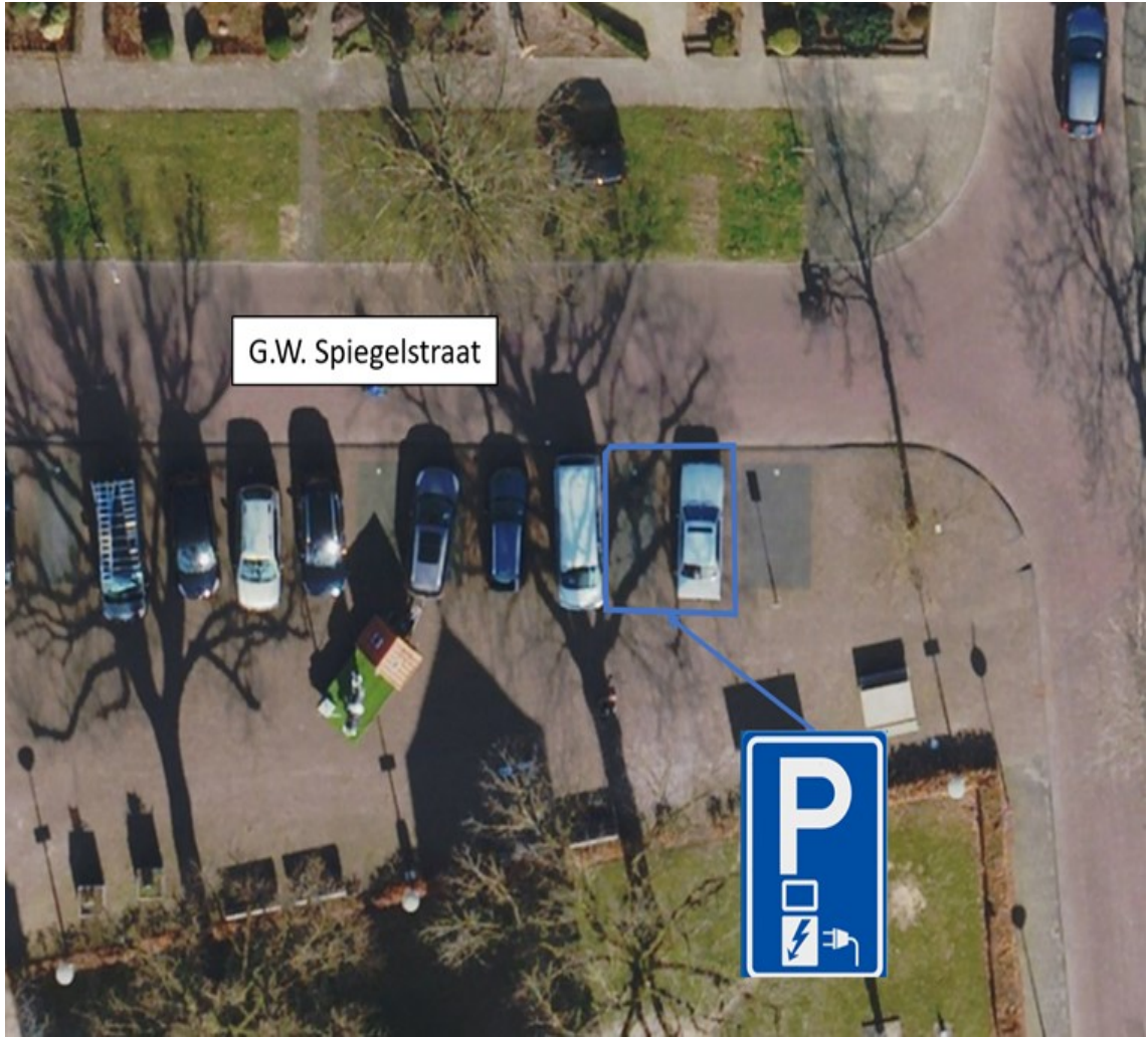
Punterstraat t.h.v. nummer 16 te Lemelerveld;