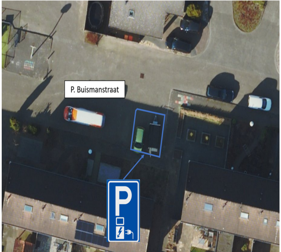
Weth. Nijboerstraat t.h.v. nummer 74 te Nieuwleusen.