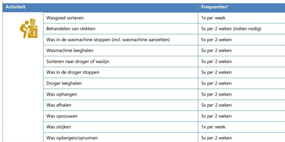
Tabel 4. Activiteiten en frequenties benodigd voor de wasverzorging

* In een tweepersoonshuishouden wordt uitgegaan van een frequentie van 5x per 2 weken voor de was, in een eenpersoonshuishouden is dat 2x per week.