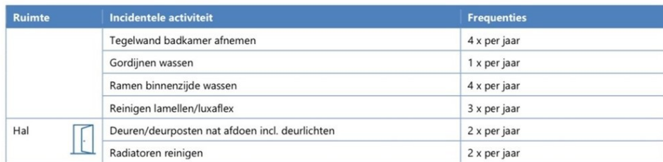
Tabel 3. Frequentie benodigd voor een schoon en leefbaar huis (incidentele activiteiten).