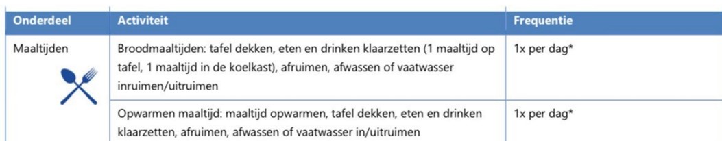
Tabel 6. Activiteiten en frequenties benodigd voor de maaltijden

* Of minder als de cliënt hierin een deel van de week zelf of met behulp van het netwerk kan voorzien.