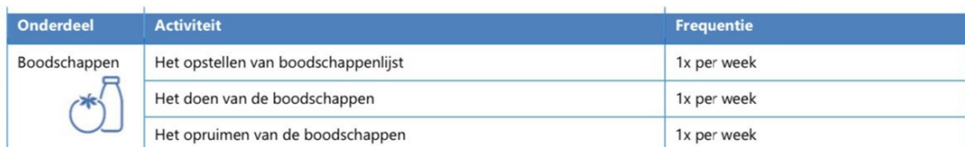
Tabel 5. Activiteiten en frequenties benodigd voor de boodschappen

* In een tweepersoonshuishouden wordt uitgegaan van een frequentie van 5x per 2 weken voor de was, in een eenpersoonshuishouden is dat 2x per week.