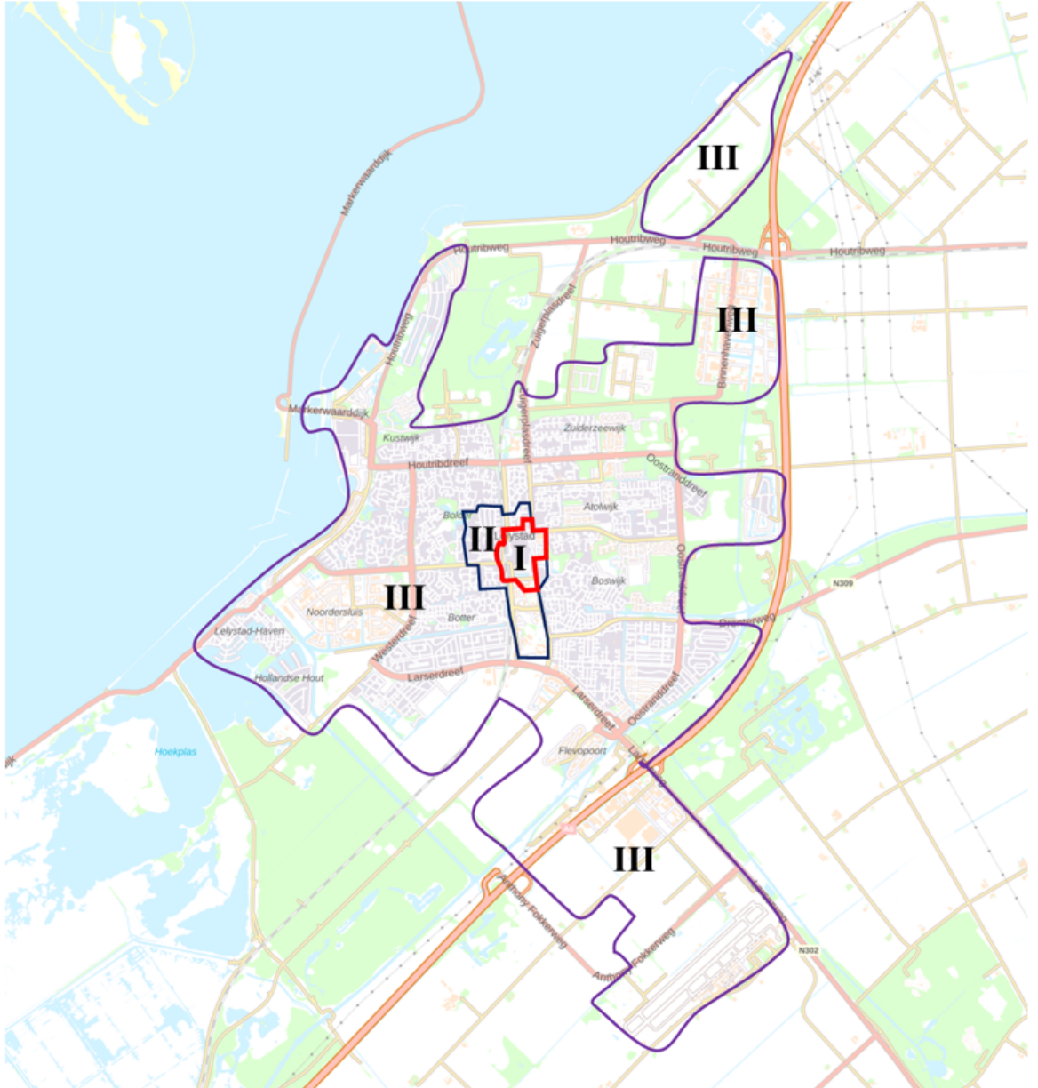
Afbeelding 3.1: Begrenzing typering gebieden