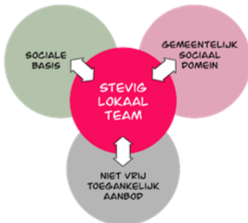
Figuur 1 Stevig Lokaal Team

Als gemeente Altena en als Regio WBO maken we een beweging naar de voorkant. We zetten in op dat jeugdigen en hun ouders leren omgaan met het feit dat hobbels bij het leven horen. We organiseren de jeugdhulp zó dat kleine problemen klein blijven en grote problemen de juiste aandacht krijgen. We kijken met een integrale blik naar de hele context van het gezinssysteem. Is er hulp nodig, dan organiseren we die 'zo thuis mogelijk'. Ouders en jeugdige hebben daarbij de regie. Dit hebben we vastgesteld in de regiovisie Jeugd (2022) . Hierin omschrijven we ook onze acht ontwikkelopgaves en onze leidende principes. Deze zijn richtinggevend bij deze subsidie.