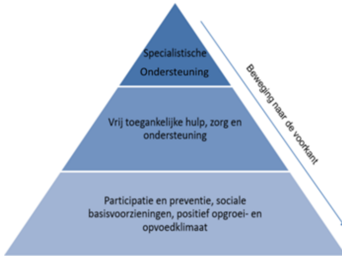
Figuur 4 Beweging naar de voorkant

De POC ontwikkelt en beproeft een integrale aanpak die bijdraagt aan het duurzaam beantwoorden van (hulp)vragen, zoveel mogelijk vanuit preventie, normaliseren, en het versterken van de sociale basis. Dit is de zogenaamde beweging naar de voorkant zoals weergegeven in figuur 4.