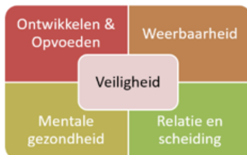
Figuur 2 Ondersteuningsvormen

De ondersteuning vindt plaats binnen de leefwereld van de jeugdige en zijn gezin/ huishouden, zoals weergegeven in figuur 3. De samenwerking en verbinding tussen de POC en deze leefwerelden zijn hiervoor noodzakelijk. Denk bijvoorbeeld aan de samenwerking met school. Zij zien kinderen bijna dagelijks en hebben hierdoor een belangrijke rol in het leven en de ontwikkeling van een kind. Veelal signaleren zij, naast de ouders, als één van de eerste wanneer er iets speelt. Zowel onder individuele kinderen, als in de klas of de buurt.