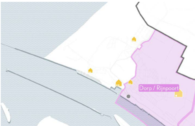
Kaart 3: Wijkogave Rozenburg

In het gebied Hoek van Holland: - Dorp/Rijnpoort.