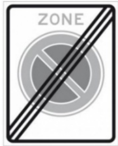
E1 (begin en einde zone)