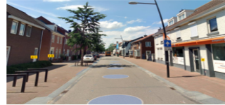
Plantenbakken Appartements De Poel

Hekken met zwart doek plaatsen voor de plantenbakken ivm vernielingen van de plantenbakken