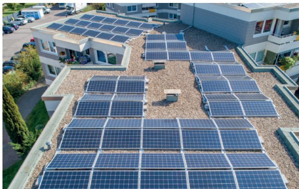
Tabel 1. Fasen inkoopproces