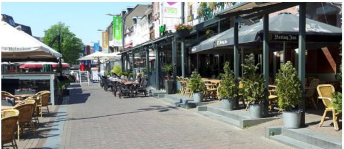
referentiebeeld Gv+ Markt Roosendaal.

Aan beide zijden van de Markt is (met inachtneming nadere regels) ruimte voor gevelterrassen (G) tot aan de aanwezige rij-, loop- en/ of calamiteitenroutes met een maximale diepte van 4 meter. In het gedeelte tussen Raadhuis en het beeld van de Tullepetaon mogen het aan de noordzijde (Markt 16 t/m 46) en aan de zuidzijde (Markt 7 t/m 15) gevelterrassen-Plus (G+) zijn. Op een aantal plaatsen op de Markt wordt specifiek ruimte geboden voor verhoogde gevelterrassen (Gv) (Markt 14 en 17) en verhoogde gevelterrassen-Plus (Gv+) (Markt 16 t/m 24, Markt 7, 9 en 30). Markt 20 en 24 gelden als referentiebeeld. Het referentiebeeld voor niet verhoogde gevelterrassen-Plus komt grotendeels overeen met dit referentiebeeld.