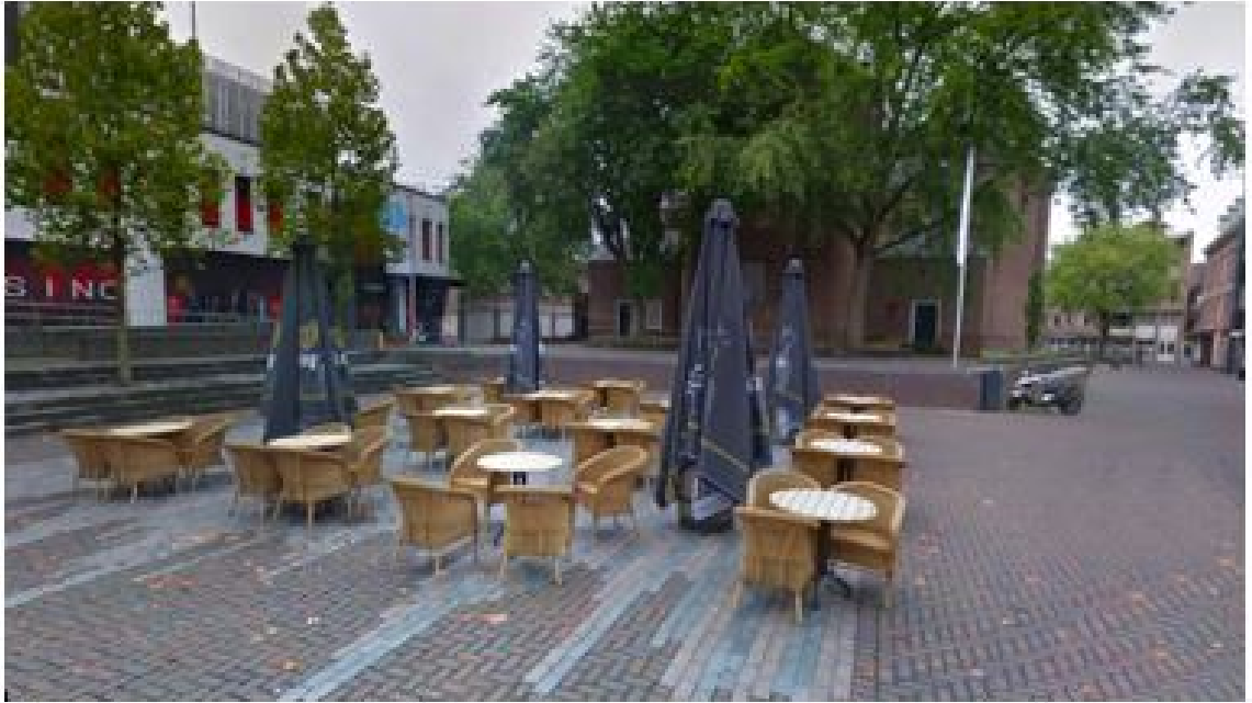
Voorbeeld voor inrichting vrij open terras op Tongerloplein.