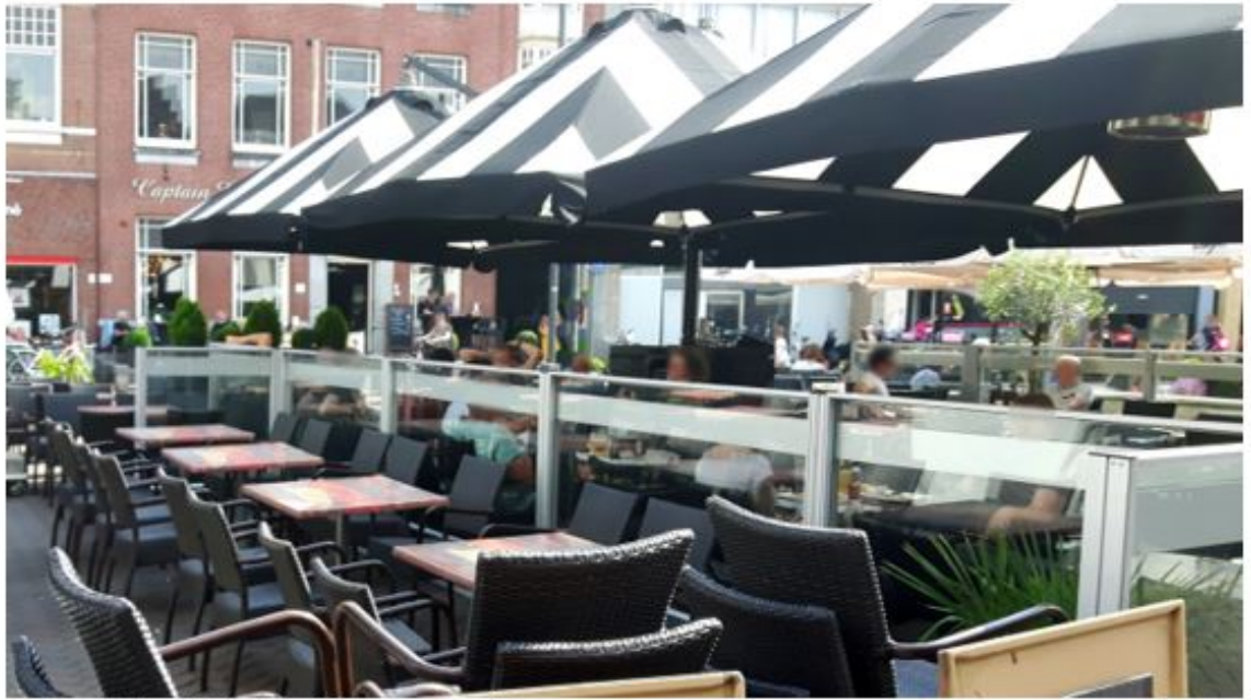
referentiebeeld Eb Markt Roosendaal 2.

In het deel van de Markt gelegen tussen het beeld van de Tullepetaon en HGD is geen ruimte voor eilandterrassen vanwege de hier aanwezige diffuse verkeerssituatie en de daar aanwezige standplaats voor voorlichting en maatschappelijke dienstverlening.