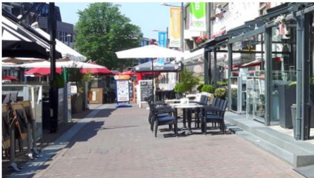
referentiebeeld Vo (1)

In de loop- en calamiteitenroute gelegen tussen Markt 16 en Markt 44 (aangeduid met blauwe 1) mogen enige gemakkelijk te verplaatsen objecten geplaatst worden als obstakels voor ongewenst fiets- en brommerverkeer; aansluitend aan het gevelterras mag dat voor hetzelfde doel een rij gemakkelijk te verplaatsen terrasmeubilair zijn, conform onderstaand referentiebeeld. Deze moeten bij sommige evenementen (net als de eilandterrassen) verwijderd worden. Hierbij geldt wel de randvoorwaarde dat op uitgaansavonden een vrije doorgang van minimaal 2,50 meter moet worden geboden. Daarnaast mogen op een drietal aangegeven plaatsen rondom het Raadhuis (aangeduid in blauw met 2, 3 en 4) in overleg met de gemeente vrije open terrassen (Vo) geplaatst worden. Vooral situatie 4 voor het raadhuis vraagt daarbij bijzondere aandacht omdat hier een hoogwaardige beeldkwaliteit gewenst is en het meubilair voor plechtigheden en evenementen desgewenst verwijderd moet worden.