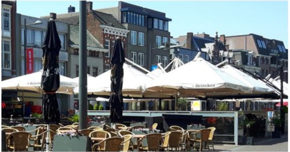
referentiebeeld Eb Markt Roosendaal 1