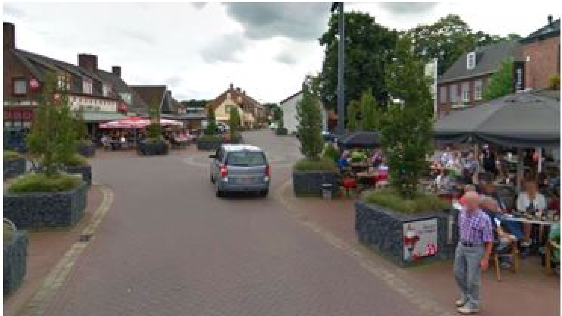
terrassen in Nispen