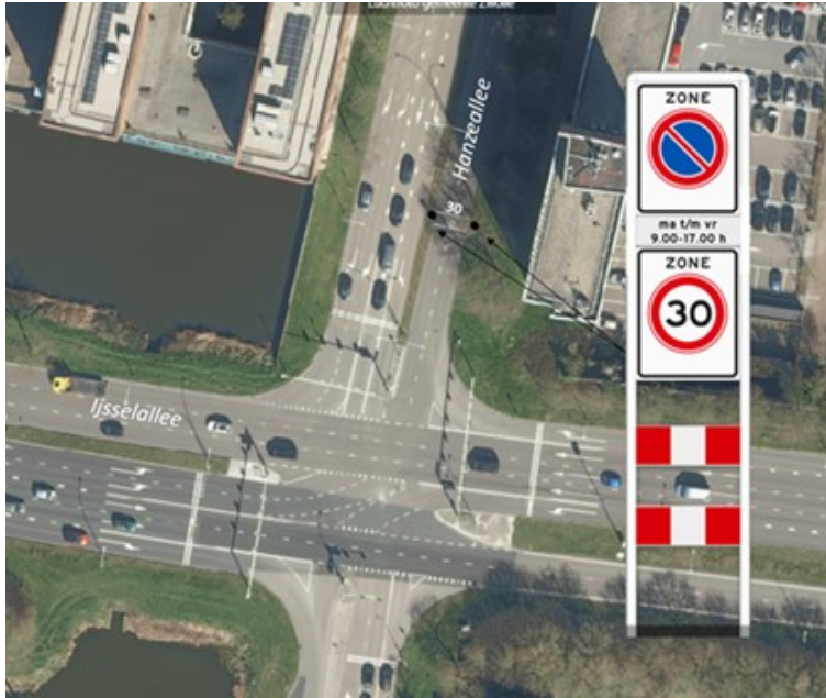
Aan te brengen 30km/h portaal Hanzeallee, ondersteund met zonestrepen en 30 markering, gecombineerd met bestaande zone verboden te parkeren.