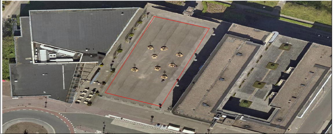
Prins Willem Alexanderplein

Het prins Willem Alexanderplein ligt centraal aan de rand van het centrum van Vaals. Het plein ligt direct langs de drukke verkeersverbinding tussen Maastricht ten Aken, zijnde Maastrichterlaan (N278). Het plein wordt voornamelijk als verbindingsroute tussen het centrum en de detailhandel welke gelegen is op het Prins Willem Alexanderplein gebruikt. Direct aan het plein, maar ook in de directe nabijheid van het plein zijn naast detailhandel ook diverse horecavoorzieningen gevestigd. Het karakter van aanwezige componenten (wonen, detailhandel, horeca) vereisen een zekere balans tussen evenementen en de dynamische omgeving ter plaatse.