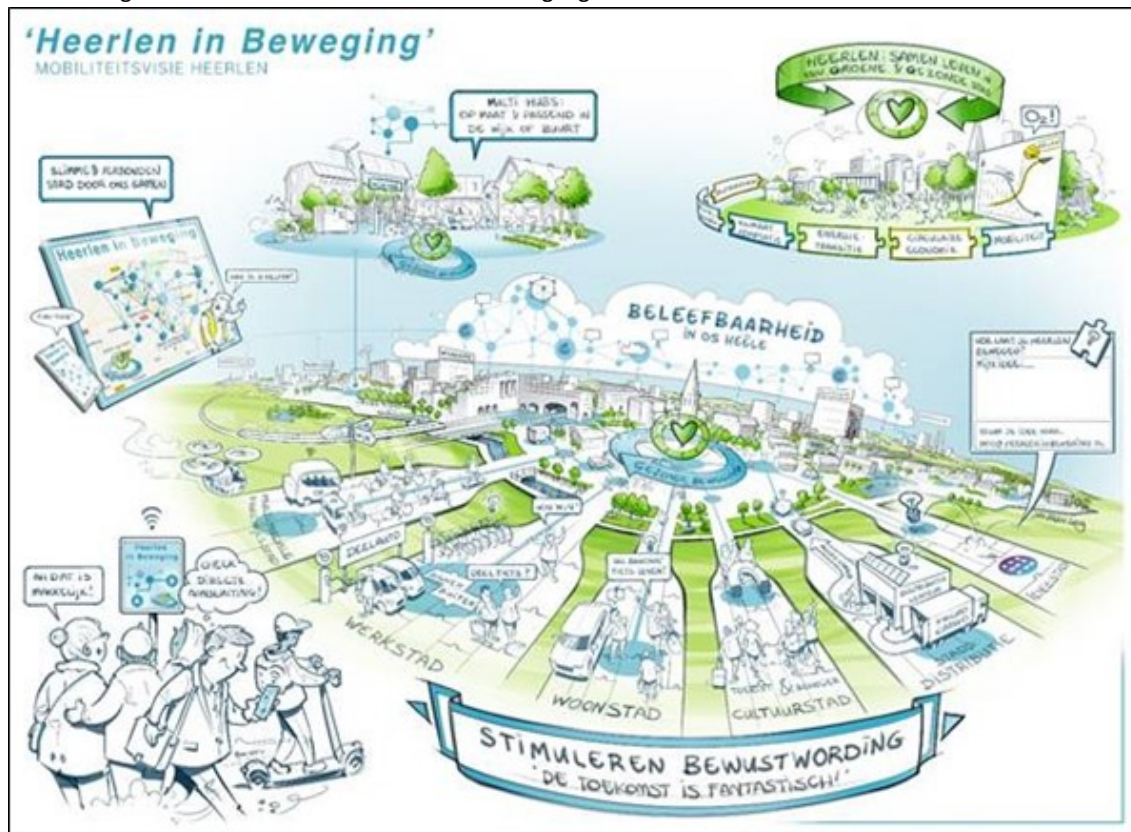
Abbeelding 1: Mobiliteitsvisie 'Heerlen in Beweging'

Voor de uitvoering van de Mobiliteitsvisie hebben we gekozen voor een flexibele en adaptieve manier van werken met jaarprogramma's met een doorkijk voor de langere termijn. We zetten hierbij in op de volgende beleidslijnen: