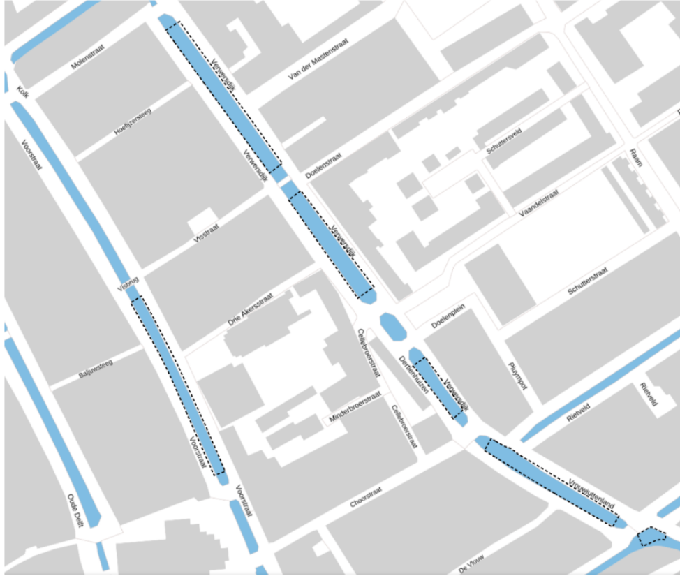
Uitsnede 1b. Terrasbotenligplaatsen Binnenwatersloot, Oude Delft, Wijnhaven en Koornmarkt