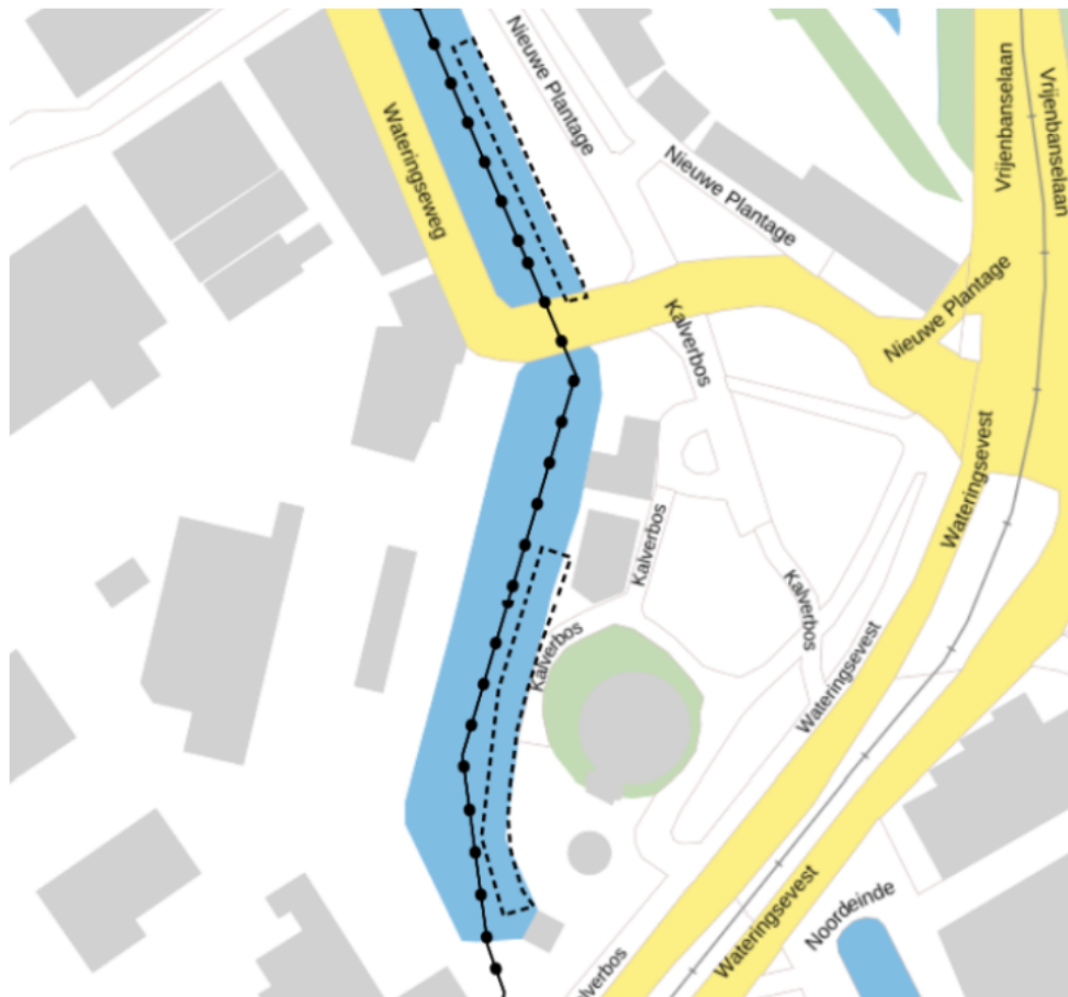
Uitsnede 2b. Woonstedenligplaatsen Kantoorgracht