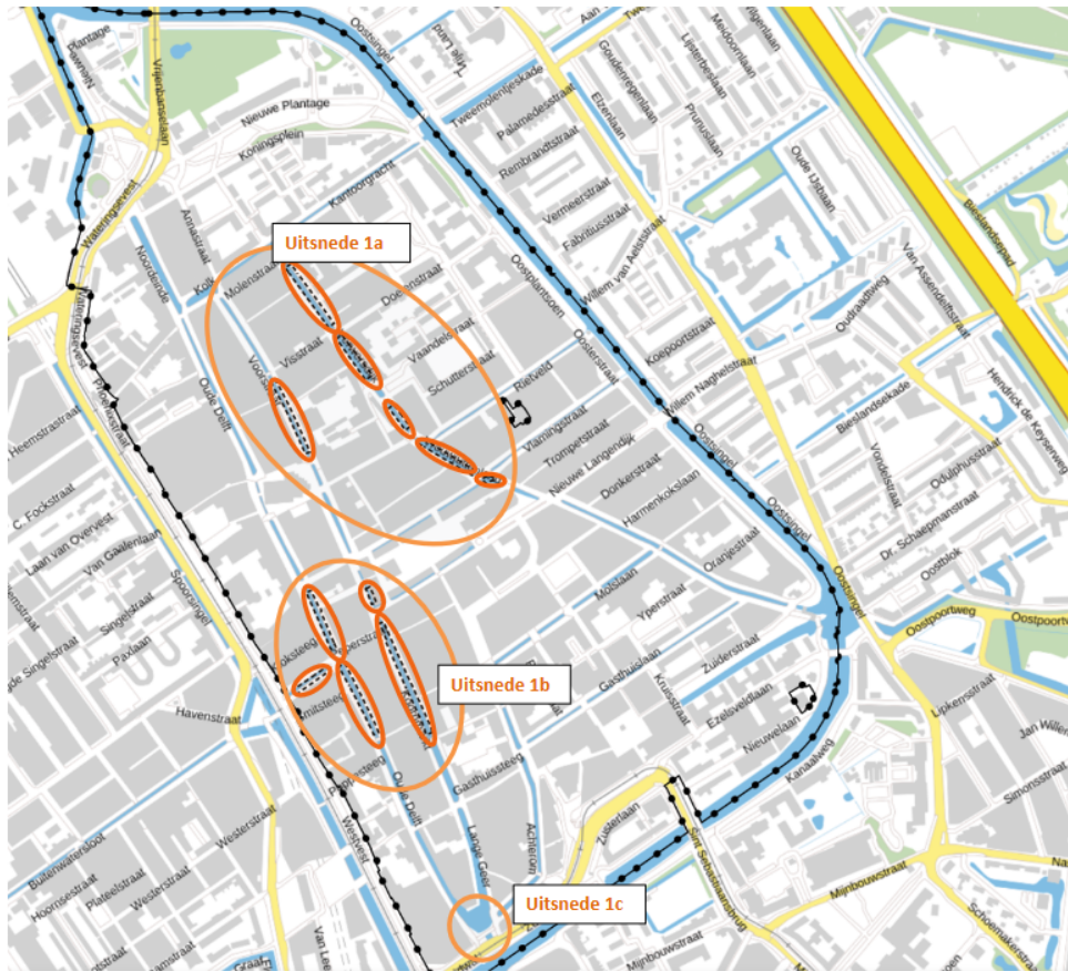
Uitsnede 1a. Terrasbotenligplaatsen Verwersdijk, Dertienhuizen, Vrouwenjutterland, Vrouwenregt