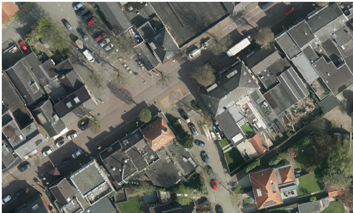
Driebergen: De Sluis