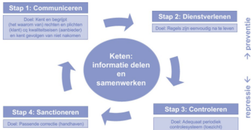
Figuur 3: Cirkel van naleving ("Handhaving en naleving Wmo 2015 en Jeugdwet", VNG juni 2017).

Effectief handhaven bestaat uit een samenspel van preventieve en repressieve acties. Hierbij geldt dat preventie voor repressie gaat, want voorkomen is beter dan genezen.