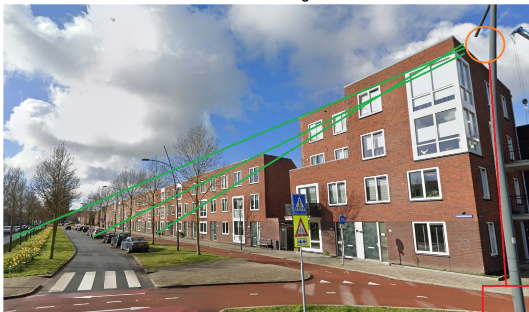
Camera 1: Ronde Saendelverlaan / Zwarte Ring/ Jura