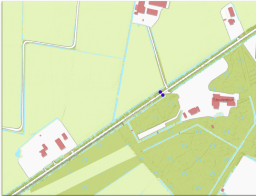
Figuur 2: beoogde locaties nieuwe bushaltes Stoutenburgerlaan