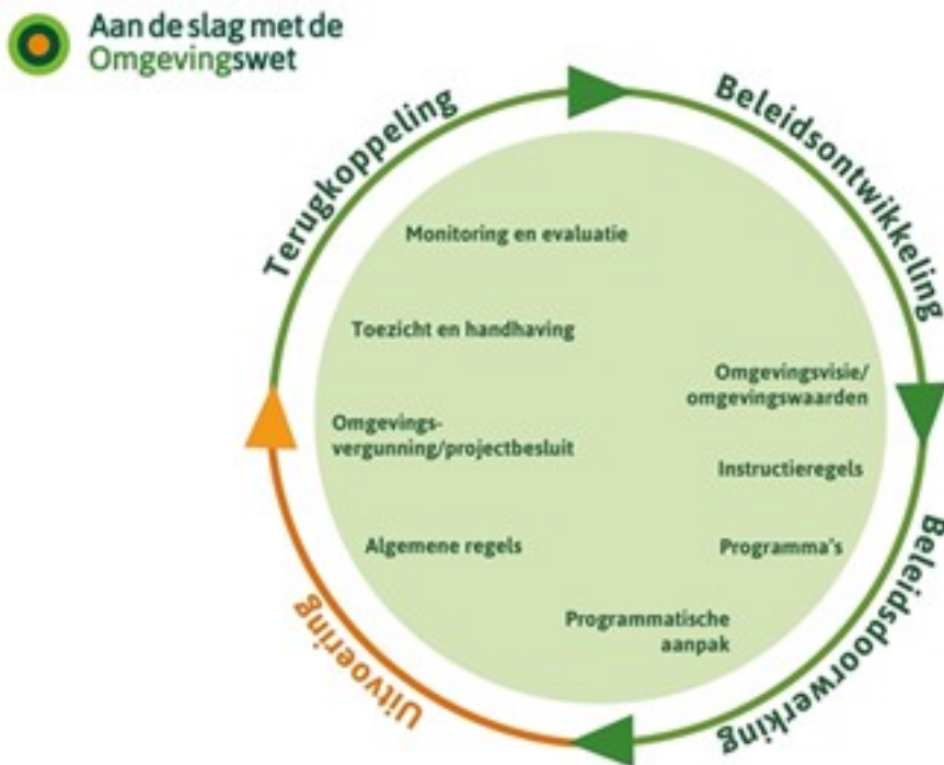
Figuur 2: Plan-do-check-act beleidscyclus Omgevingswet

Naast de Big-8 bestaat onder de Omgevingswet ook een beleidscyclus (zie figuur 2). De opbouw van de Omgevingswet volgt deze beleidscyclus. De beleidscyclus biedt een structuur om de instrumenten van de Omgevingswet te ordenen. Deze kent een vergelijkbare opzet (Plan, do, check, act). De Omgevingswet heeft zes kerninstrumenten voor het gebruiken en beschermen van de leefomgeving. Met deze instrumenten kan de overheid beleid schrijven en uitvoeren. Daarnaast kunnen overheden met deze instrumenten regels stellen aan activiteiten en de uitvoering van projecten. De zes kerninstrumenten zijn: de omgevingsvisie, het programma, decentrale regels, algemene rijksregels, de omgevingsvergunning en het projectbesluit.