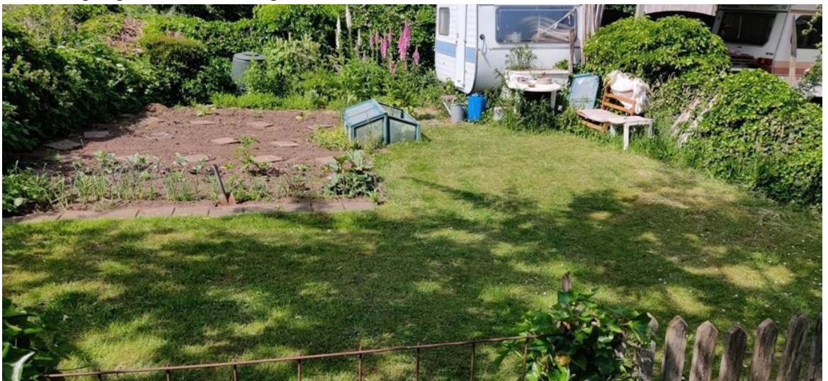
Afbeelding 3: Volkstuinen met caravans