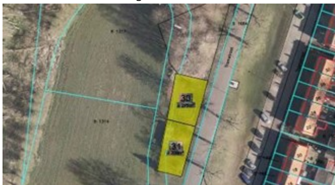
Figuur 5: Kavel 30 & 31 nabij Tramstraat

Vastgesteld is dat kavels 30 en 31 niet bijdragen aan de gewenste landschappelijke uitstraling van Bredevoort. Om deze reden zijn deze kavels uit niet langer verhuurd als zijnde volkstuint. Dit is afgestemd met Bredevoorts Belang.