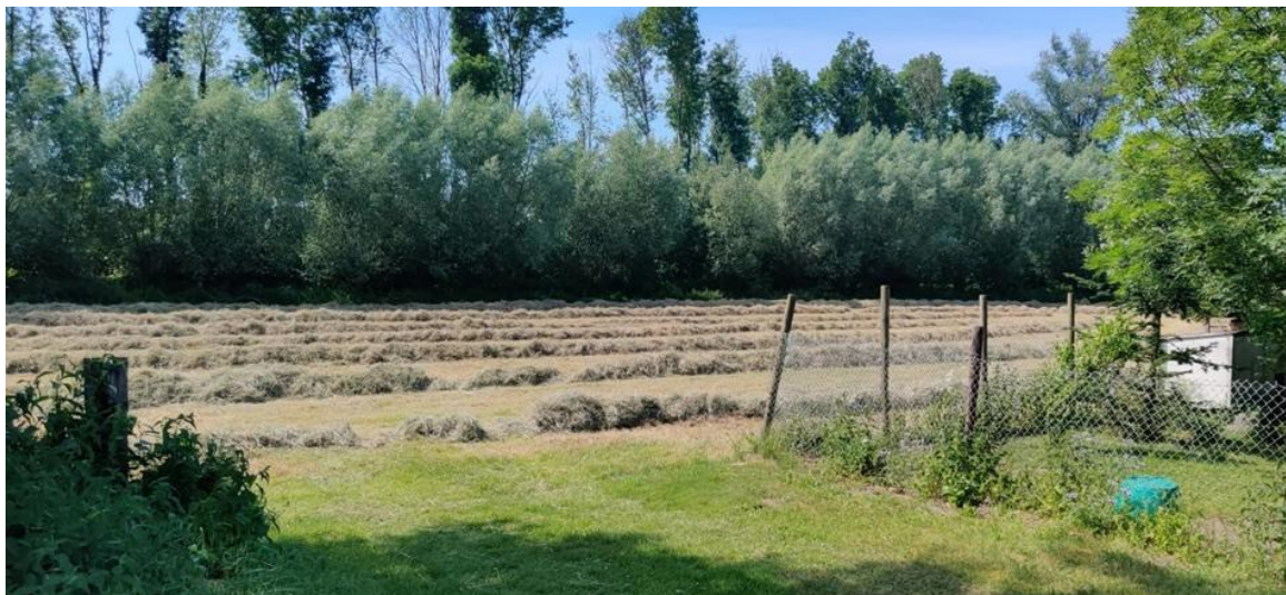
Afbeelding 6: Knotwilgen bij Halve Moane