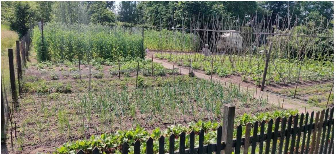
Afbeelding 2: gewenste uitstraling volkstuin