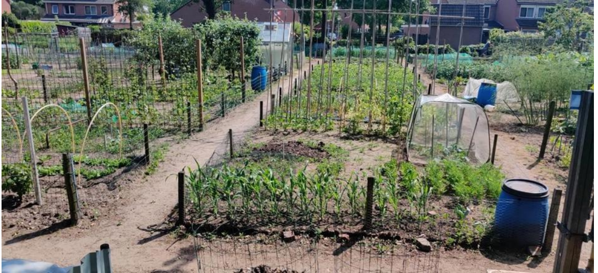
Afbeelding 1: overzichtsfoto volkstuinen