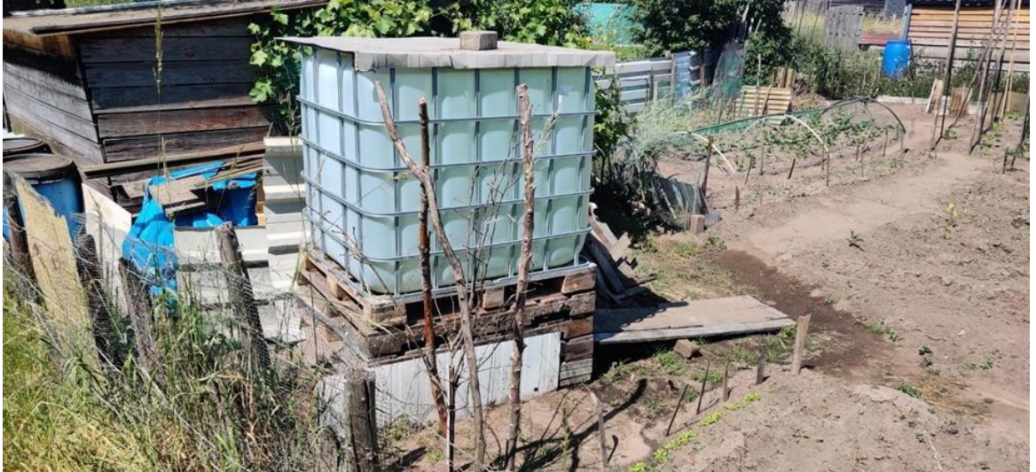
Afbeelding 4: Volkstuin met opslag