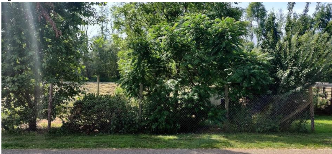
Figuur 8: Volkstuin Tramstraat 2