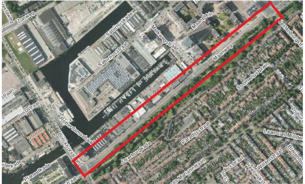
Figuur 1: Luchtfoto bestaande situatie, de Maanweg is rood omkaderd.