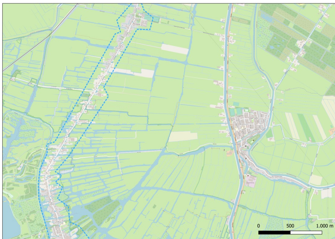
Kaart 3: Den IJp/Purmerland (bebouwde kom) – Gebied: Turquoise (zie tabel 2)