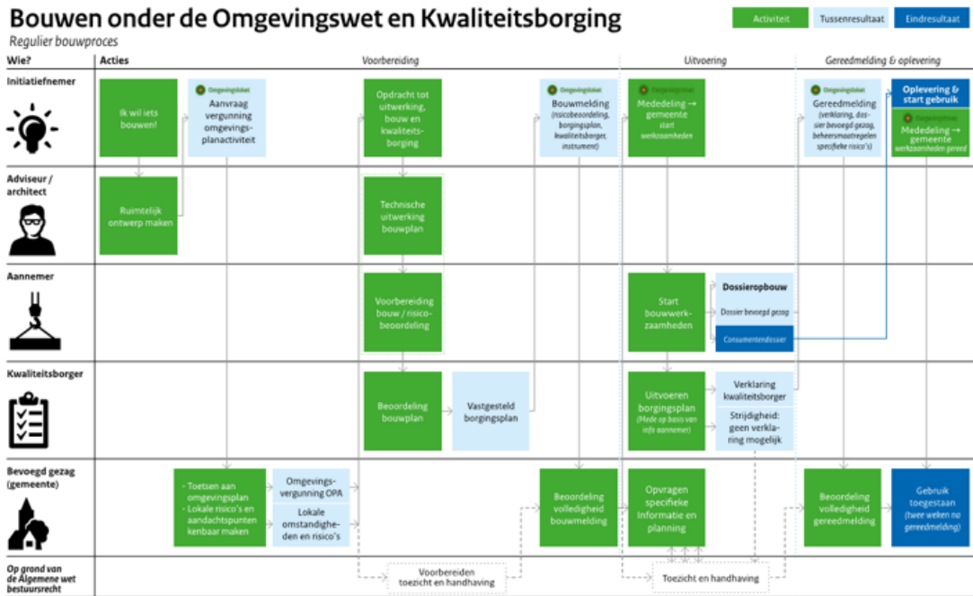
Schema 2: proces Wkb