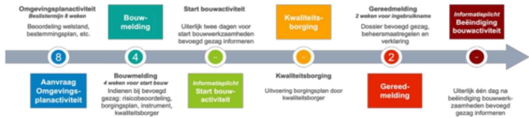
Schema 1: beknopte schematische weergave proces Wkb met termijnen

Intern zijn hierover praktische afspraken gemaakt met team Vergunningen, omdat ook zij een aandeel hierin (blijven) hebben.