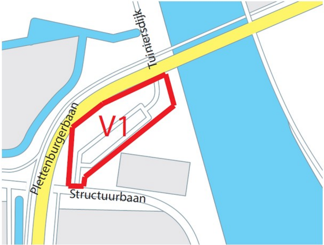
Kaart 2 van 2