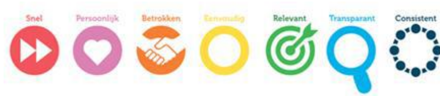
Figuur 2 Dienstverleningsprincipes van de Omgevingswet