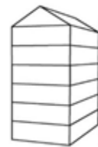
UV6 - Urban villa 6-laags met zadeldak