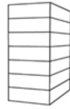
P7 - Flat 7-laags plat