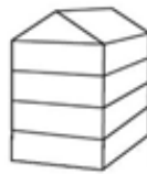
UV4 - Urban villa 4-laags met zadeldak