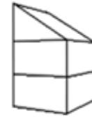
H3 - Woning 3-laags lessenaarsdak