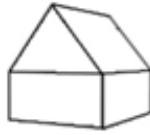
K2 - Woning 2-laags zadeldak