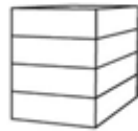
P4 - Flat 4-laags plat