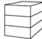
P3 - Woning 3-laags plat dak