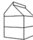
S4 - Woning 3-laags verspringend lessenaarsdak