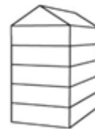
UV5 - Urban villa 5-laags met zadeldak