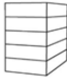
P5 - Flat 5-laags plat