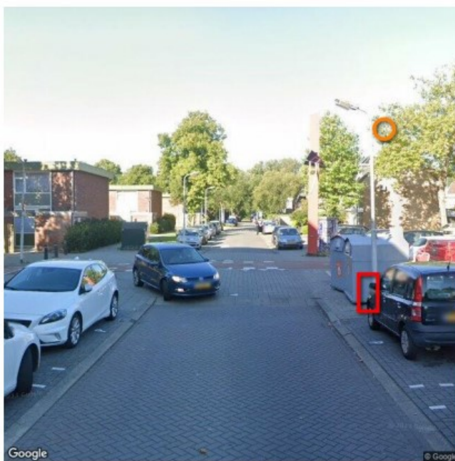
Camera 2 – Lobiusstraat