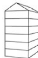
UV6 - Urban villa 6-laags met zadeldak