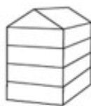
UV4 - Urban villa 4-laags met zadeldak