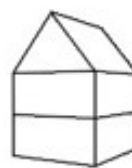
K3 - Woning 3-laags zadeldak