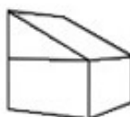
H2 - Woning 2-laags lessenaarsdak