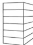
P6 - Flat 6-laags plat