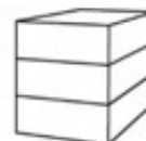
P3 - Woning 3-laags plat dak