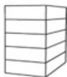
P5 - Flat 5-laags plat