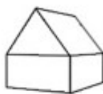
K2 - Woning 2-laags zadeldak