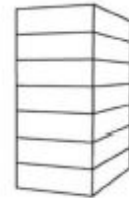
P7 - Flat 7-laags plat