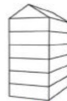
UV6 - Urban villa 6-laags met zadeldak