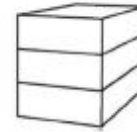
P3 - Woning 3-laags plat dak