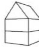
K3 - Woning 3-laags zadeldak