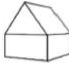
K2 - Woning 2-laags zadeldak