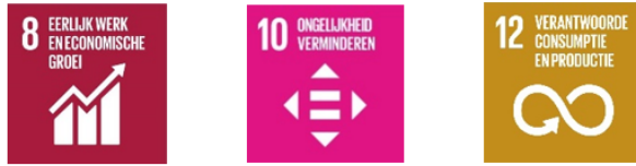
Fig. 2 De drie belangrijkste global goals binnen het evenementenbeleid