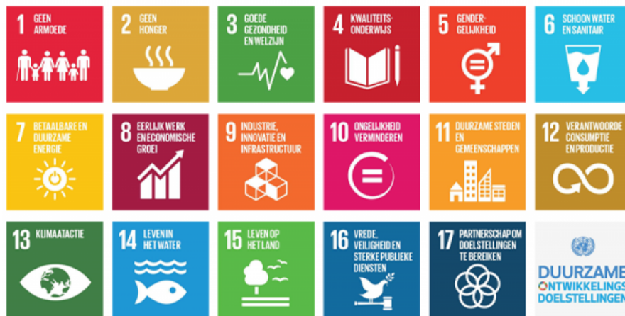
Afbeelding 1. De 17 global goals

Het evenementenbeleid is tot stand gekomen in een samenwerking tussen een multidisciplinaire ambtelijke werkgroep en de raads werkgroep. Daarnaast zijn de organisatoren van evenementen, vertegenwoordigd door een aantal stakeholders, nauw bij de opstelling van het voorliggende beleid betrokken. Het beleid is gebaseerd op een aantal strategische documenten en de Global Goals . De rode draad in deze gemeentelijke stukken is de koestering van het landschap, het behoud van de eigenheid van de diverse kernen en een grote mate van zelfsturing door de bewoners, bedrijven en organisaties. Daarnaast is er vanzelfsprekend voor een Global Goal-gemeente aandacht voor de inzet voor een duurzame, rechtvaardige, veilige en welvarende wereld.