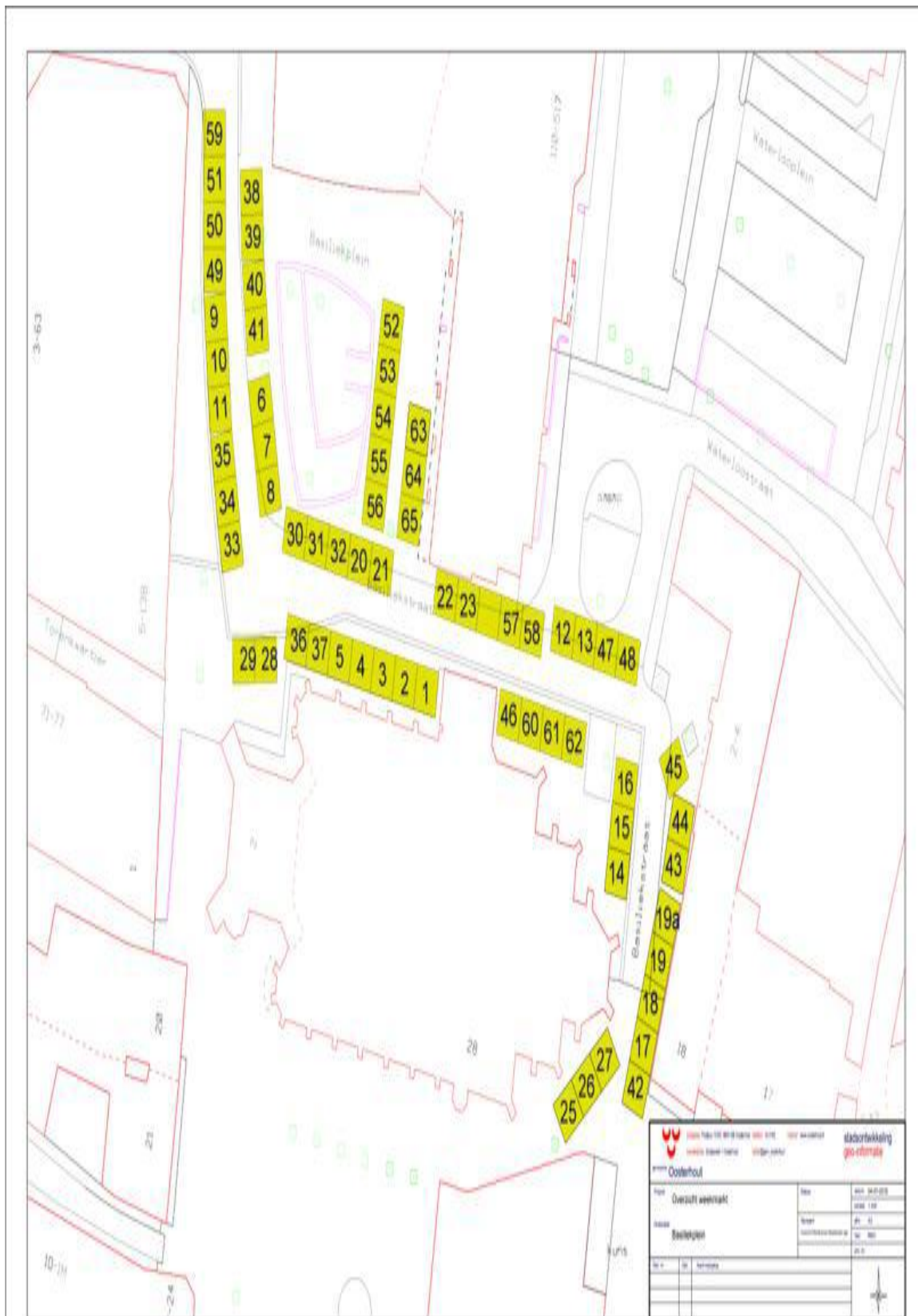
Overzicht Marktkenmen Raslielklein don 4.7.2018 16:14:33