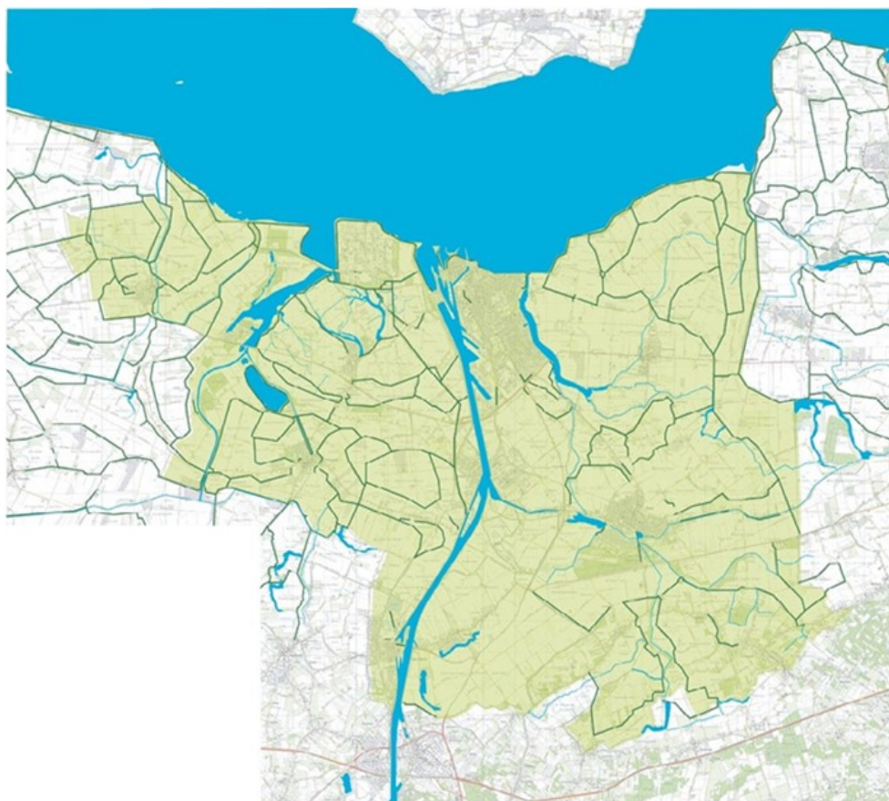
Water en dijken