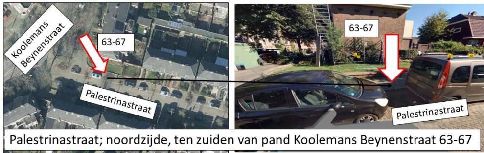
Palestrinastraat; noordzijde, ten zuiden van pand Koolmans Beynenstraat 63-67