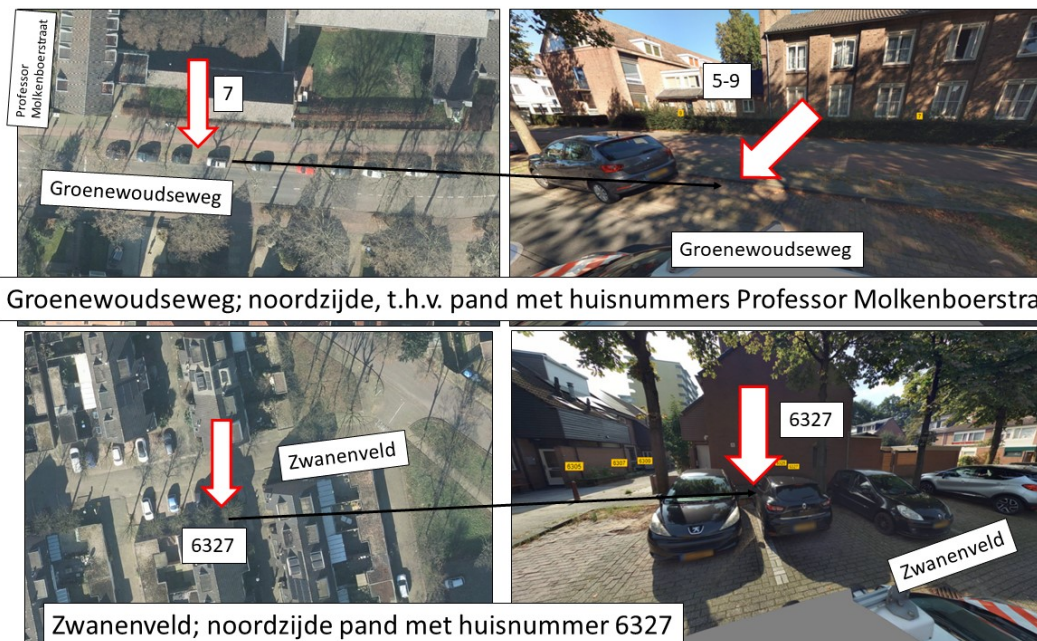
Groenewoudseweg; noordzijde, t.h.v. pand met huisnummers Professor Molkenboerstraat 5-9

Het indienen van een bezwaarschrift schorst de werking van dit besluit niet. Degenen die een bezwaarschrift hebben ingediend kunnen, indien er sprake is van spoedeisend belang, tevens op grond van artikel 8:81 van de Algemene wet bestuursrecht, bij de president van de Rechtbank Arnhem, sector bestuursrecht, Postbus 9030, 6800 EM Arnhem vragen een voorlopige voorziening te treffen. Voor het behandelen van een dergelijk verzoek wordt griffierecht geheven.