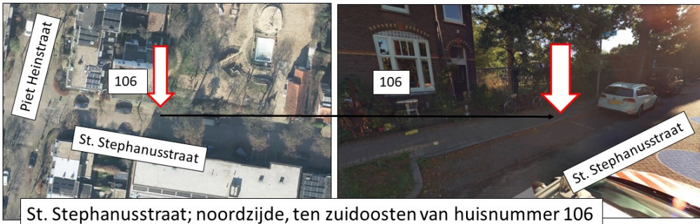
St. Stephanusstraat; noordzijde, ten zuidoosten van huisnummer 106