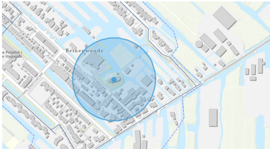
1. Berkenwoude, de Nederlands Hervormde kerk, Dorpsstraat 20