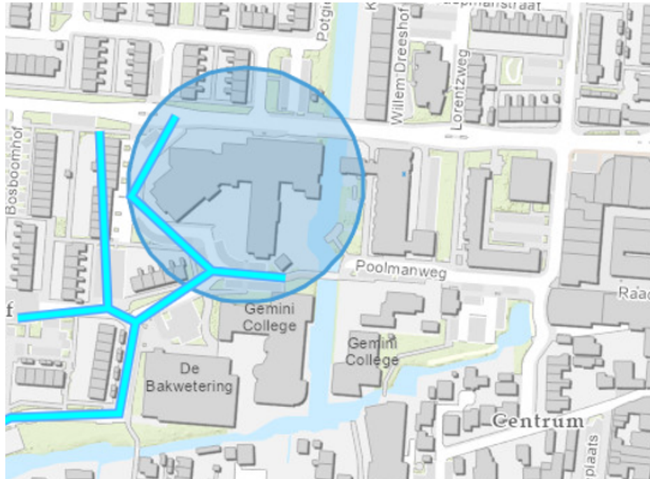
8. Lekkerkerk De Breeje Hendrick/De Waterpoort Nicolaas Beetsstraat