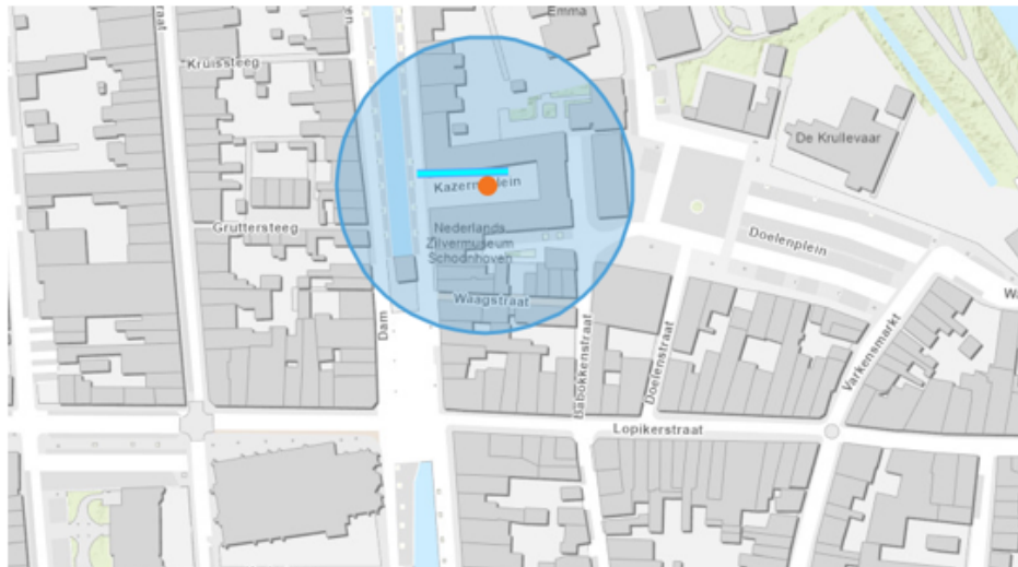
10. Schoonhoven Het Zilvermuseum Kazerneplein