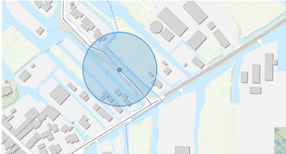
6. Berkenwoude, dierenparkje Dreef