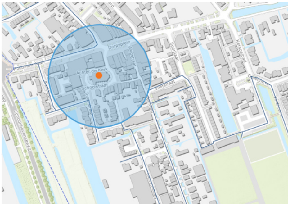
4. Stolwijk De Nederlands Hervormde kerk, Achter de kerk 3