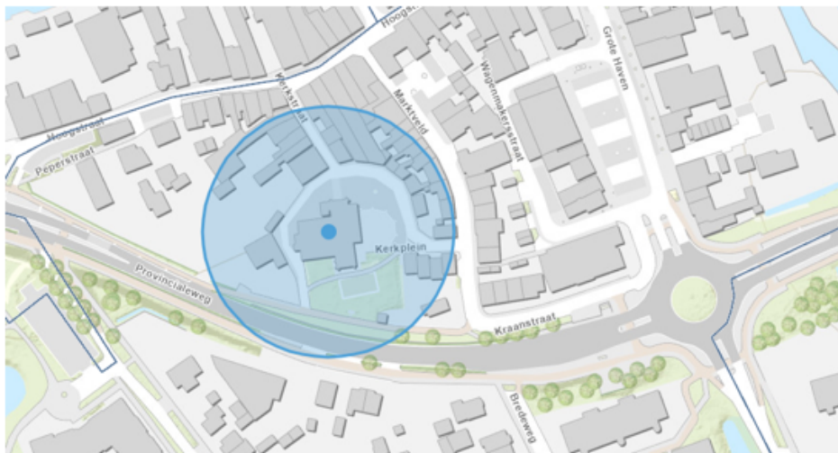
9. Haastrecht, Nederland Hervormde kerk, Kerkplein 9