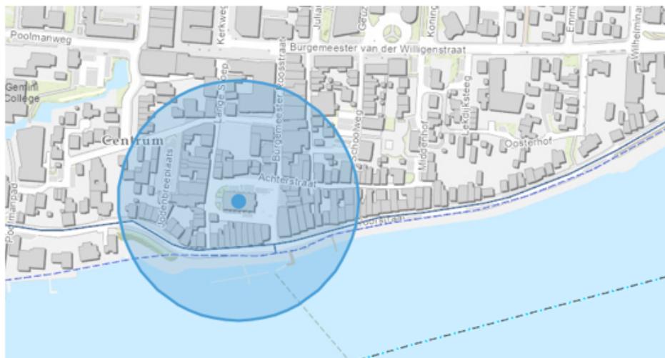
2. Lekkerkerk, de Grote of Johanneskerk Kerkplein 4