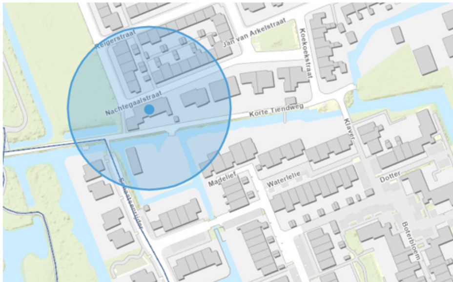
7. Haastrecht, paardenstal aan de Nachtegaalstraat 13