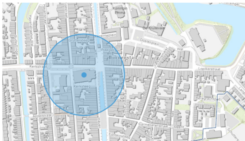
3. Schoonhoven, De Grote of Bartholomeüskerk Haven 8