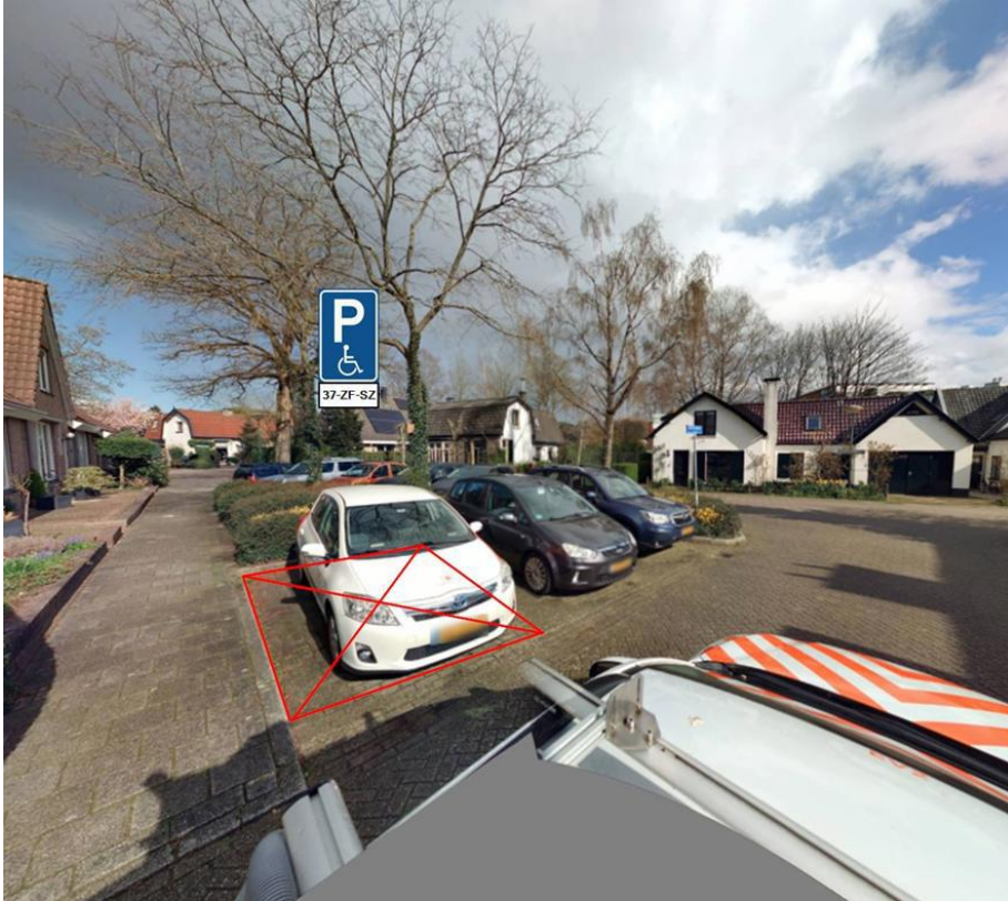
Kampdwarsweg 3, Doorn